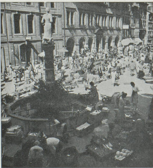
Jour de marché à Lausanne

C'est le théâtre rêvé des vacances, la plage, la