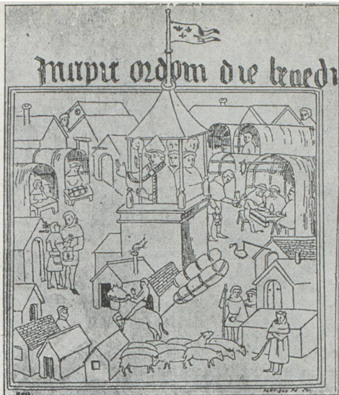
La Foire du Lendit

Bien avant la conquête romaine, la Gaule était déjà un pays relativement riche et peuplé où le commerce était assez développé. Les réunions druidiques qui se tenaient périodiquement dans la région de Chartres donnaient lieu à des foires. A Lyon, on célébrait la fête du dieu celtique Lugus, de caractère analogue à celui de Mercure; ces cérémonies provoquaient un important mouvement d'échanges commerciaux.