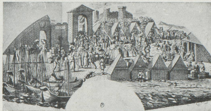
La Foire de Beaucaire

Pendant le XVIII e siècle, les anciennes foires tombèrent en décadence ; elles étaient l'occasion de jeux, d'attractions diverses et les affaires ne jouaient plus qu'un rôle secondaire. Après la Révolution, on assiste au développement d'un nouveau genre de manifestations, les expositions, qui se distinguent des foires par un caractère d'ampleur et de durée et par la longueur relative des intervalles qui les séparent. C'est en l'an VI que se tint au Champ de Mars la première exposition des produits de l'industrie française ; il n'y eut que 110 exposants. Une dizaine d'autres expositions eurent lieu à