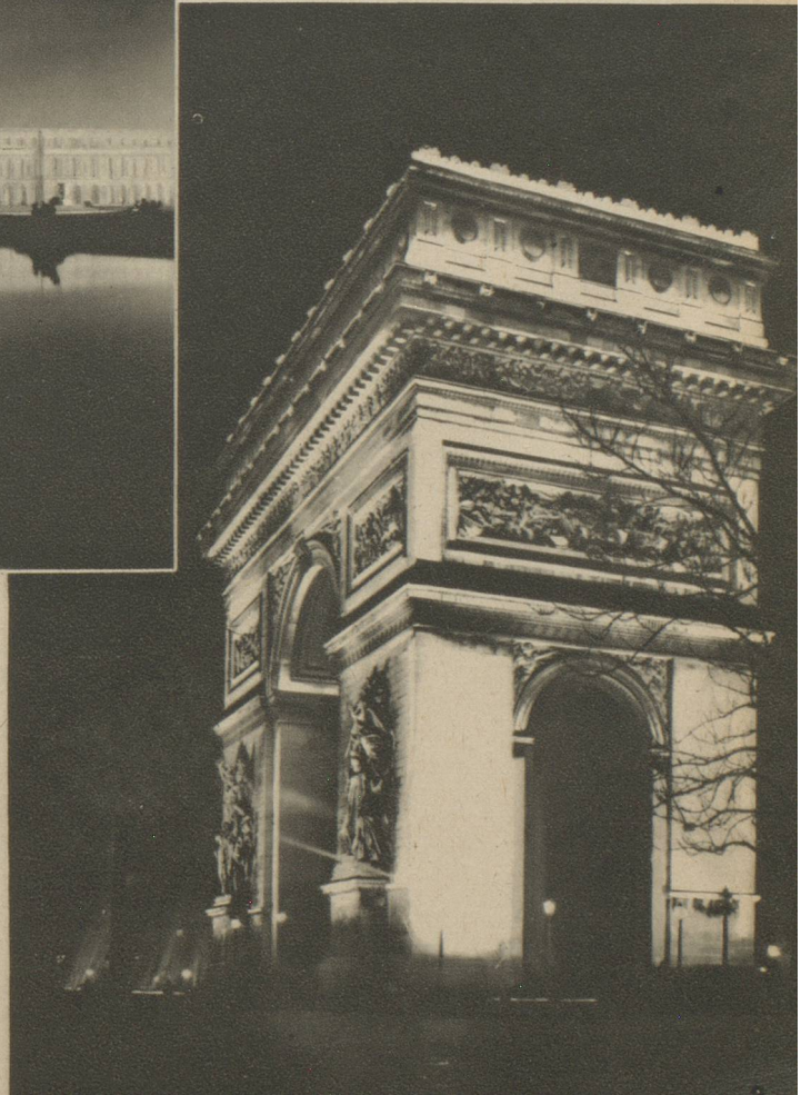
PARIS. — ARC DE TRIOMPHE.