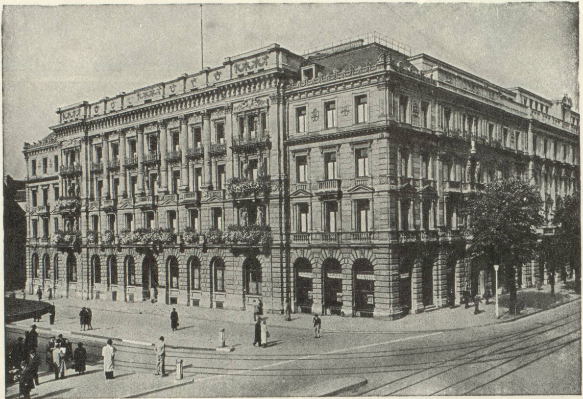
Hôtel de la Banque à Zurich