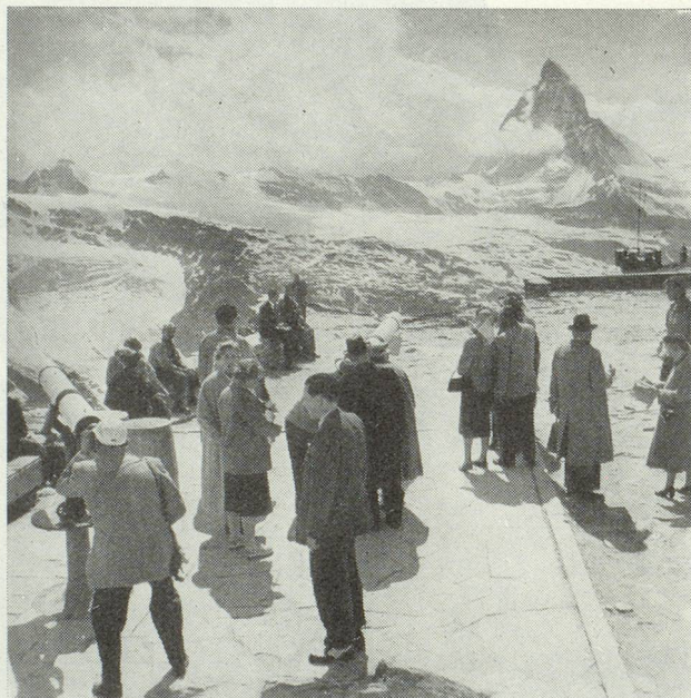
Les membres du Club au sommet du Gornergrat

l'un portant son assiette et l'autre son couteau