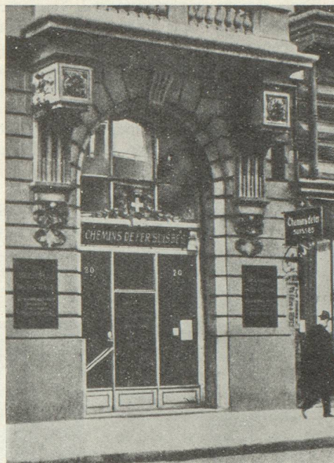
L'entrée de l'agence officielle des Chemins de fer suisses au n° 20 de la rue Lafayette (1908-1925)

Ce que l'on voit maintenant, au boulevard des Capucines, ne s'est pas fait en un jour. L'agence de