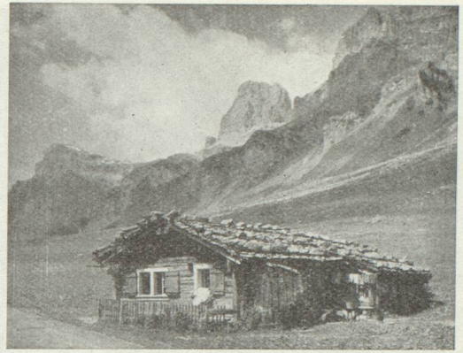
Chalet de montagne dans la région du col du Klausen