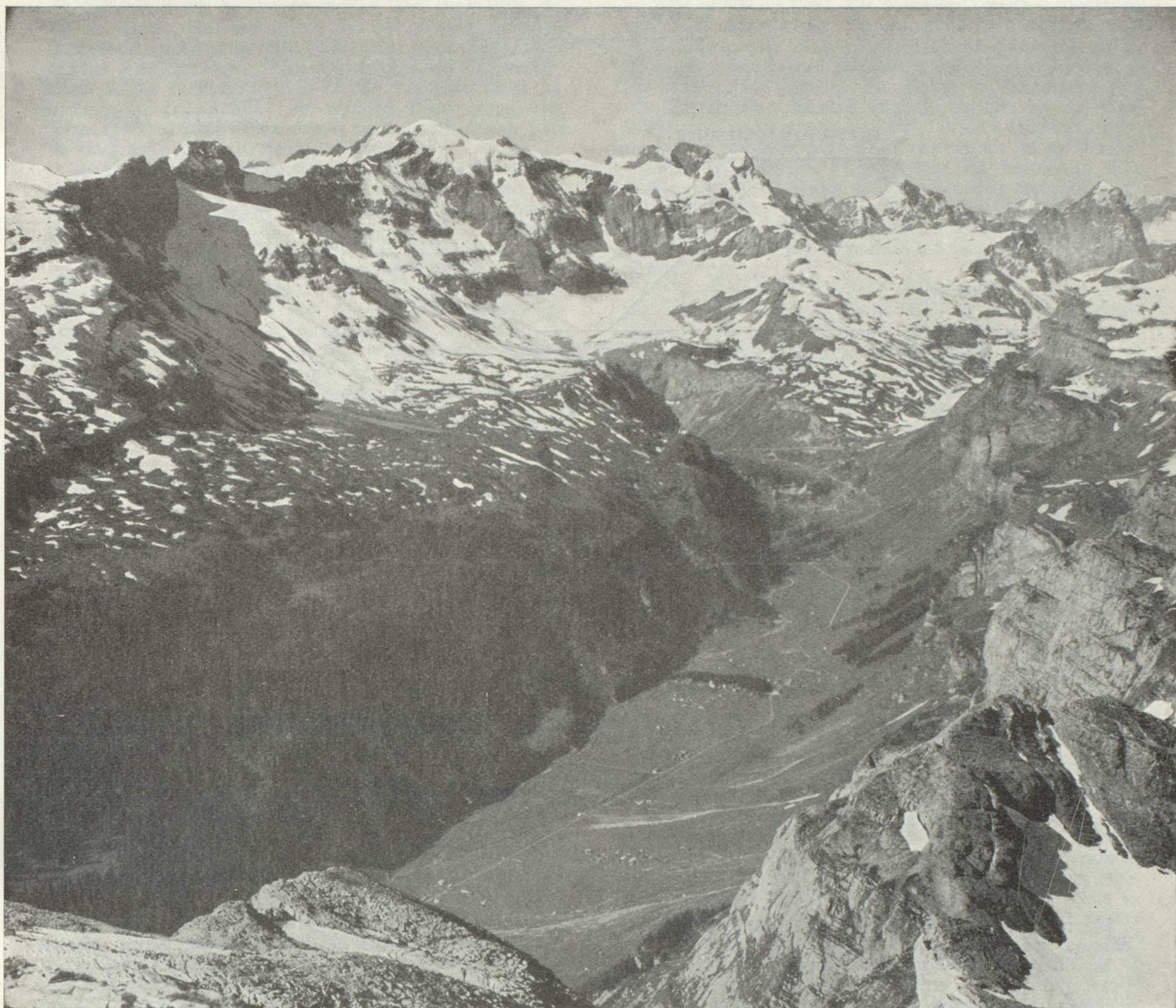
Vue de l'Ortstock sur le canton d'Uri et le Klausen

d'Uri fut réveillé peu après minuit par le coq maigre, alors que son adversaire de Glaris dut attendre les premières lueurs de l'aube pour entendre le chant de l'animal trop bien repu. Malgré sa célérité, son retard sur l'homme d'Uri était si grand que leur rencontre se fit au pied de la montagne, à deux heures à peine de Linthal. Devant le désespoir du champion de Glaris, l'Uranais se montra bon prince. Il accepta de lui rendre, à condition que son compère le porte à califourchon, le terrain ainsi parcouru. Le Glaronnais fit de son mieux. A bout de souffle, il parvint jusqu'au ruisseau qui, aujourd'hui encore, marque la limite des deux cantons. Le robuste enfant de la vallée de