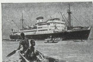
Notre couverture: Le « Général Leclerc », de la Compagnie maritime des Chargeurs réunis, en rade de Dakar.

REVUE ÉCONOMIQUE FRANCO-SUISSE 33 e ANNÉE • JUIN 1953