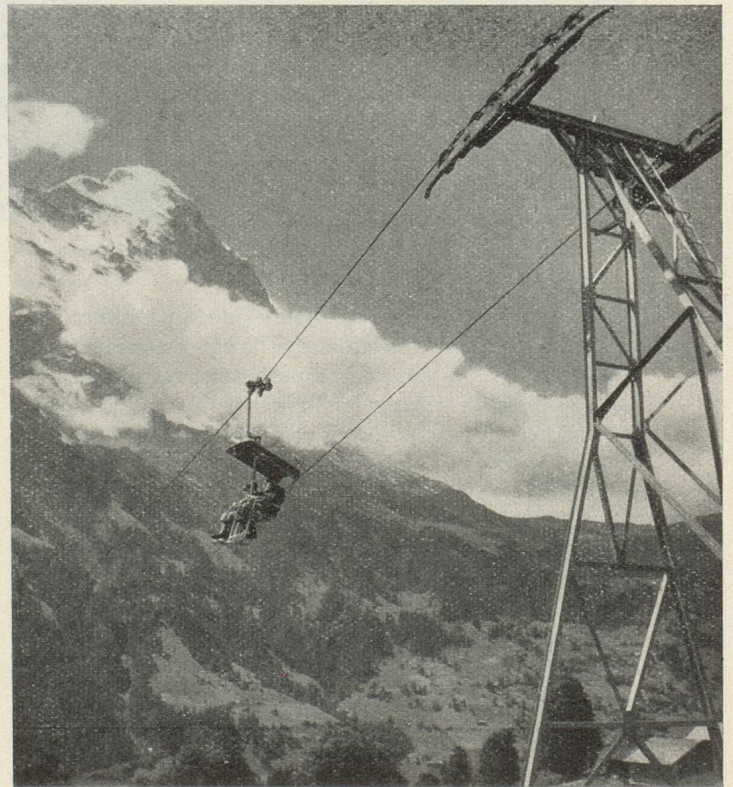
Le télésiège de Grindelwald