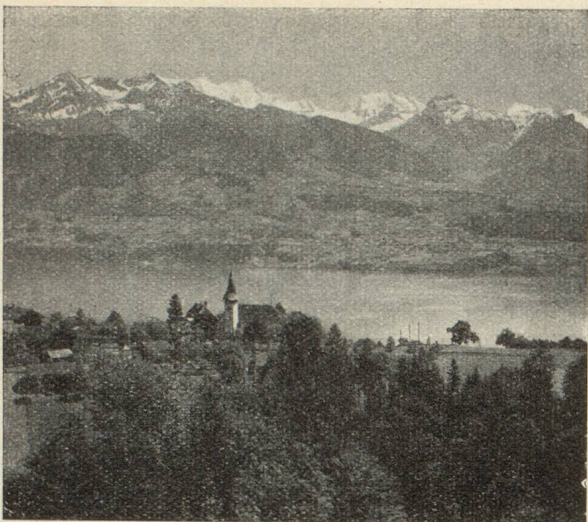
Sigriswil, au bord du lac de Thoune