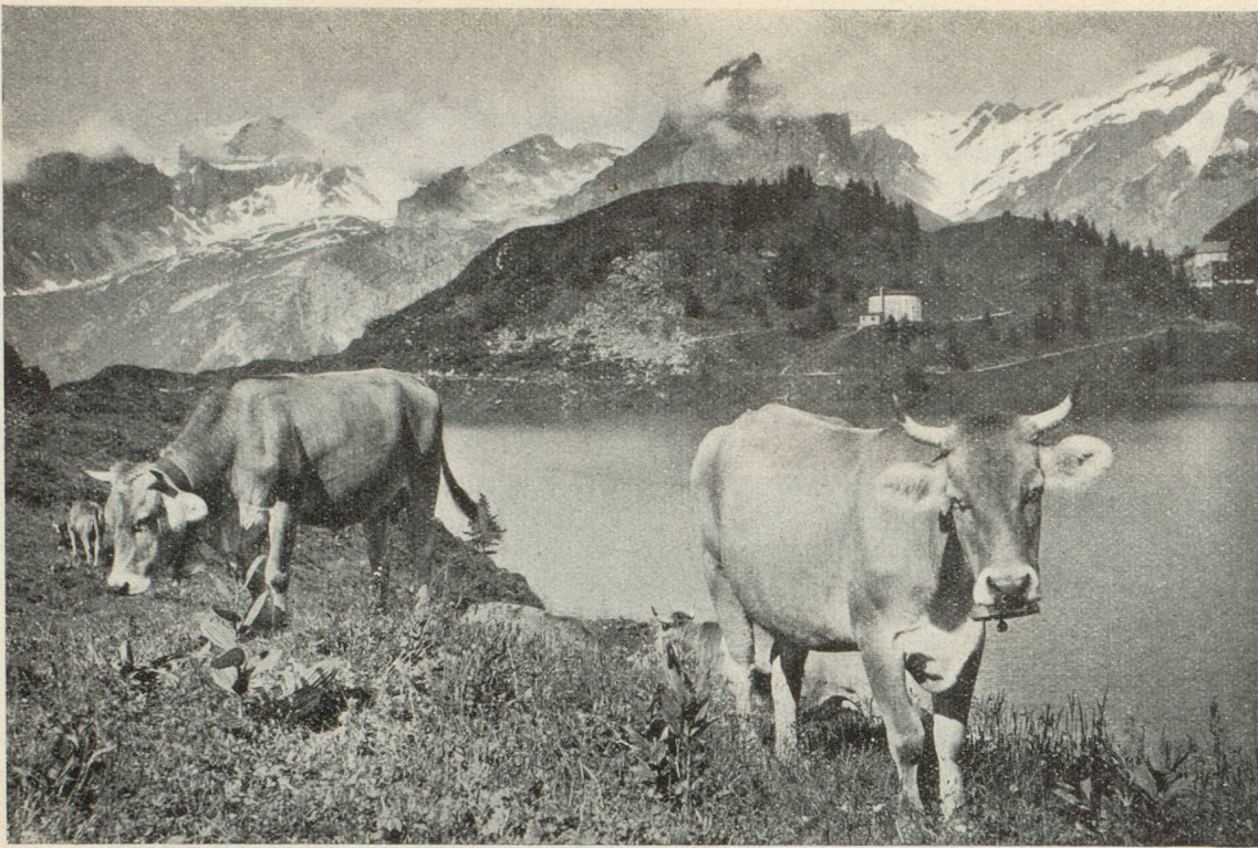
« L'automne est le temps où la Suisse pastorale révèle le mieux son existence... » Le Trübsee au-dessus d'Engelberg

cette euphorie qui épanouit les âmes devant les harmonies de la nature et de l'art. La partie suisse du Lac Majeur leur offre des retraites tout aussi enchantées à Locarno, si mollement étalé au milieu d'une végétation plus méridionale encore, tandis qu'Ascona et ses grèves font durer jusque tard dans l'année le plaisir du bain et que Brissago se mire en face des deux joyaux naturels que sont ses îles, rattachées et