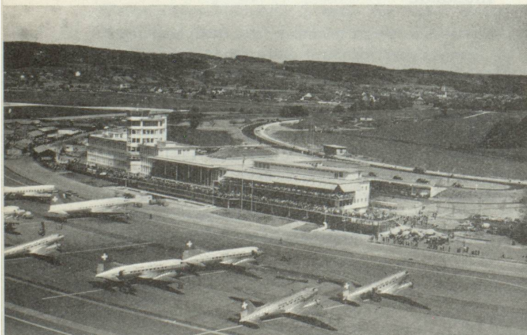
L'aéroport de Zurich-Kloten.

de la compagnie au delà des limites de l'Europe. Des services furent créés entre la Suisse et le Proche-Orient, notamment à destination du Caire. Divers vols d'essai furent, en outre, conduits dans différentes directions tandis que, pendant un certain temps, un service relativement régulier relia la Suisse à Johannesburg, en Afrique du Sud. Par la suite, la Swissair ouvrit également une ligne à destination des États-Unis. En 1949, enfin, elle prit livraison de quatre Convair Liners destinés à moderniser sa flotte d'avions pour distances moyennes.