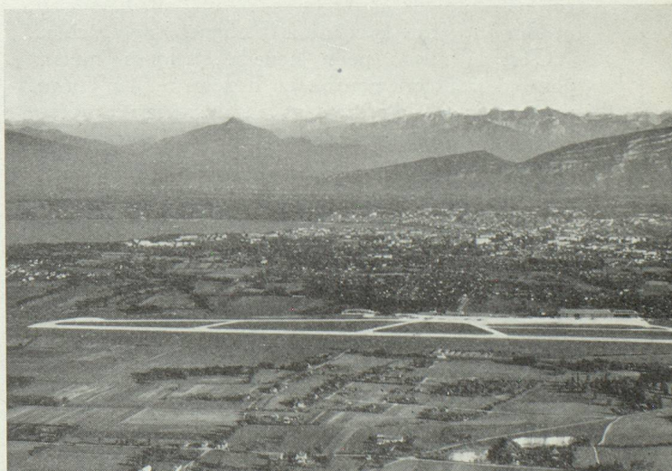
L'aéroport de Genève-Cointrin.

Mais ce n'est pas seulement par la présence de ses avions à l'étranger que la Swissair œuvre en faveur de la Suisse. Par l'hospitalité qu'elle offre à ses passagers, par la qualité de son service à bord et l'excellence de ses repas, elle est une réclame... volante pour l'industrie hôtelière suisse. Par sa ponctualité, elle rappelle que la Suisse est le pays de la bonne horlogerie