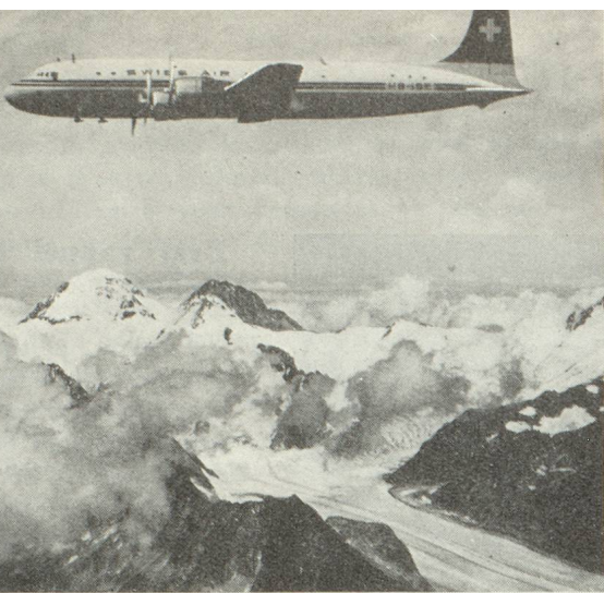
Un DC-6B survolant les Alpes.

Celle-ci n'allait pas tarder à prouver toute son importance en temps de paix. Les sept ans qui se sont écoulés depuis la fin des hostilités l'ont démontré.