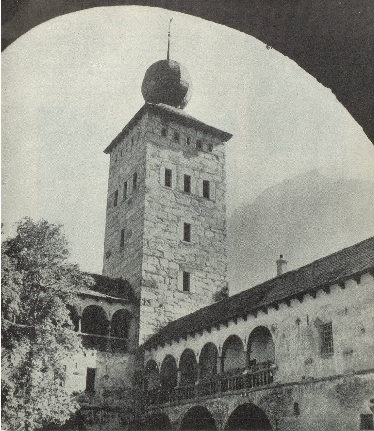
Le Palais Stockalper à Brigue.