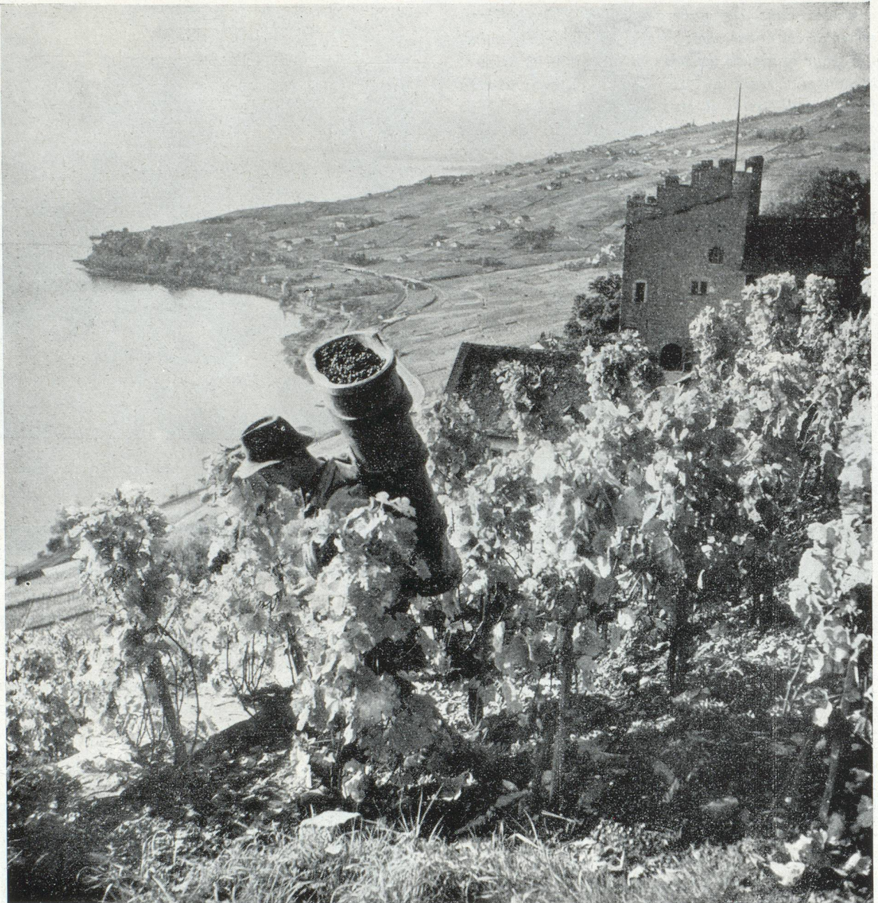
Vignobles du Lavaux