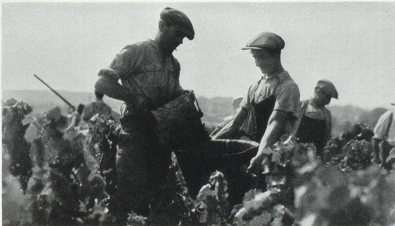
Les vendanges dans le Beaujolais