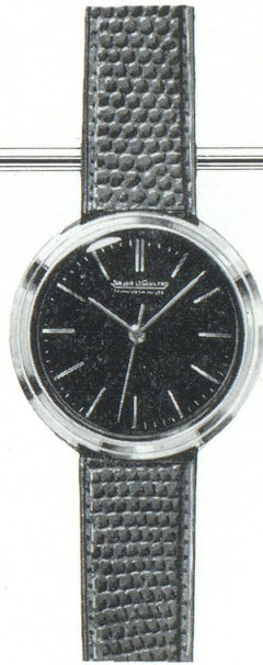
10. R. SC. 6