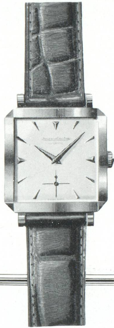
10. CA. 1