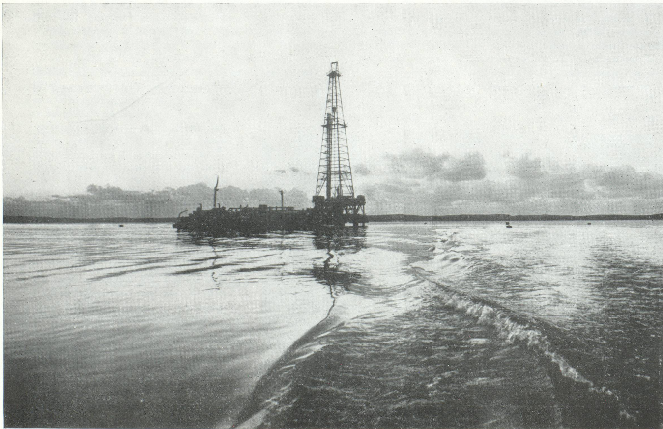
Puits lacustre le P 18 à Parentis