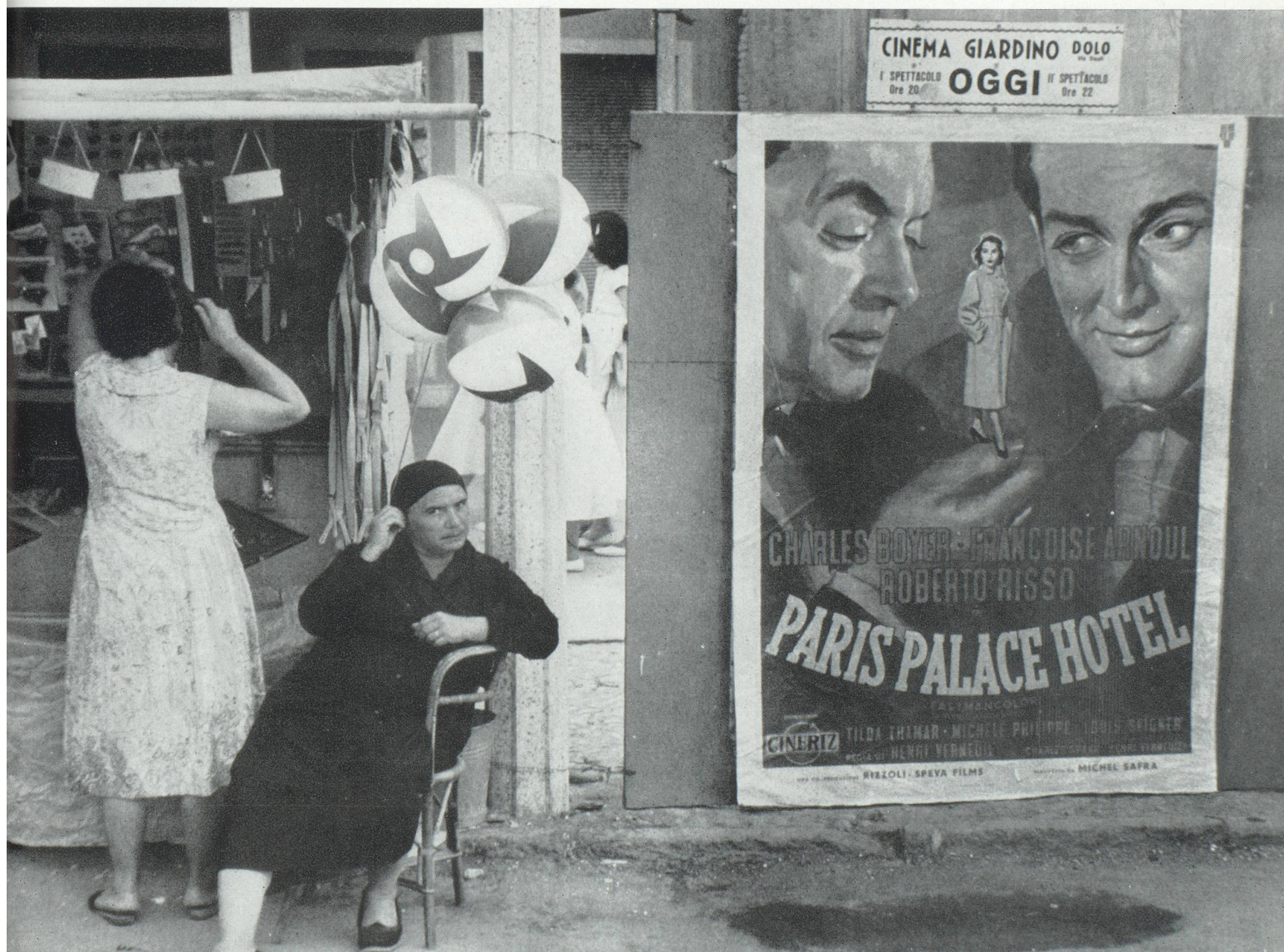
Les affiches plus parlantes que les êtres vivants.