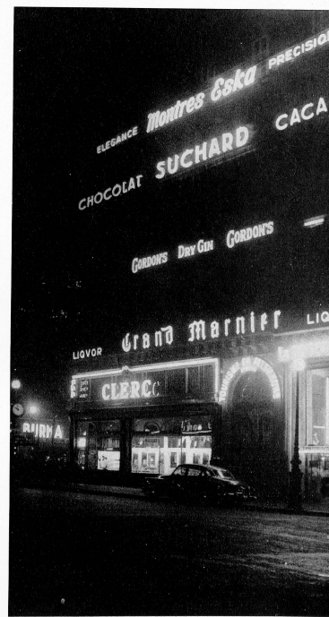
Paris la nuit : le Café de la Paix.

Ce moyen publicitaire est très développé en France où un grand nombre d'annonceurs le prévoient dans leur budget et, pour satisfaire la plupart d'entre eux, le cinéma publicitaire a été amené tout naturellement à réduire la longueur des films de telle façon qu'un