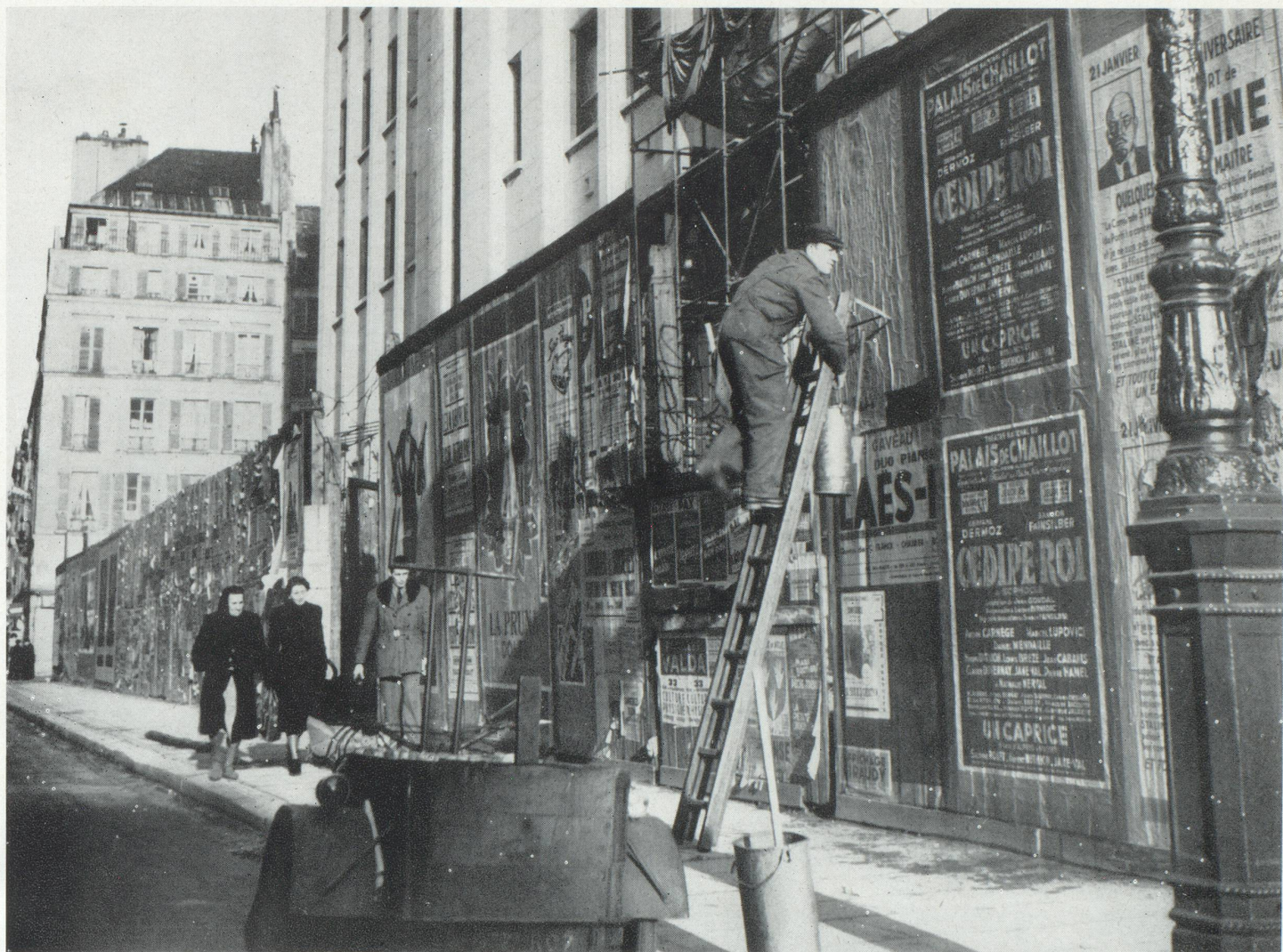
Colleur d'affiches, rue des Saints-Pères, à Paris.

risquant ainsi de déséquilibrer leur exploitation : l'exemple de l'Amérique nous a montré que les nouveaux supports, radio et télévision, ont accru le chiffre d'affaires global de la publicité et que celui imparté aux anciens supports a eu la même proportion d'augmentation. Par exemple, le support presse est en augmentation de 17 %.