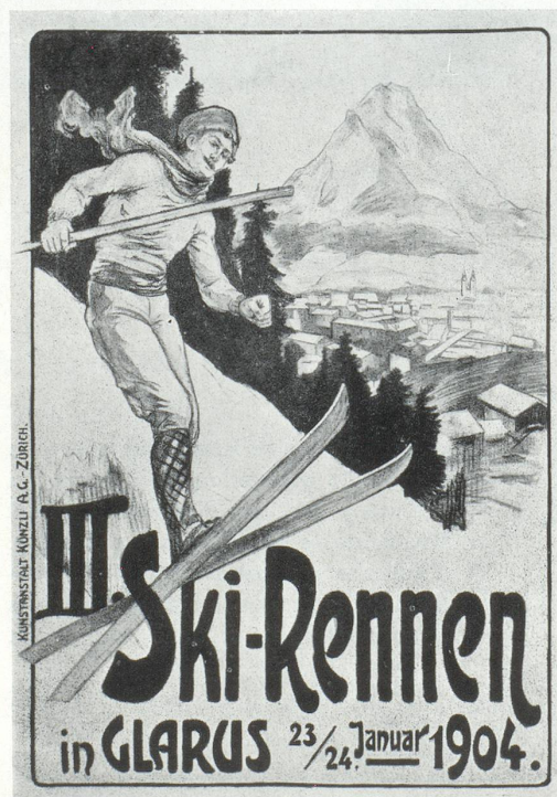
Affiche anonyme, Courses de ski à Glaris, Zurich 1904.

La richesse et la subtilité des couleurs, les arabesques aussi charmantes qu'ingénieuses ne suffiront plus pour faire d'une belle image, une bonne affiche. Le temps des promenades