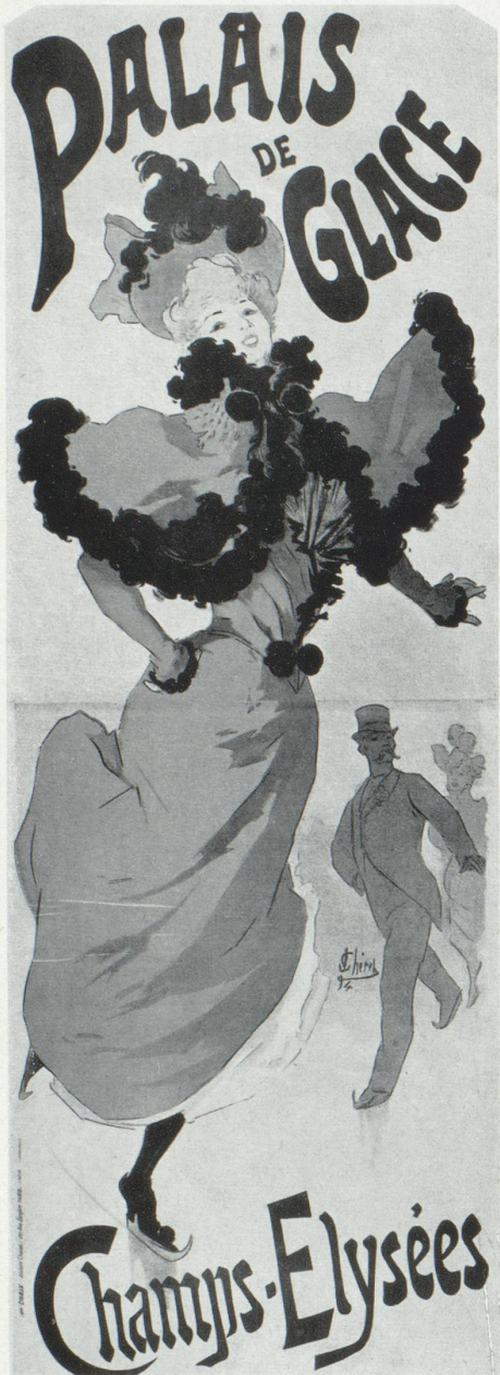
Affiche de Jules Chéret, Palais de Glace, Paris 1894, 245 x 87 cm.

coup plus riche et intense, et un trait d'un contour beaucoup plus relâché et spontané au point que l'on pourrait dire de beaucoup d'affiches modernes, voire des meilleures, qu'elles ne sont qu'un agrandissement de petites pochades, respectant scrupuleusement tout le laisser-aller qu'elles peuvent comporter. Mais ne nous y trompons pas : c'est d'un laisser-aller « scientifique », pourrions-nous dire qu'il s'agit, auquel ne peuvent prétendre les médiocres.