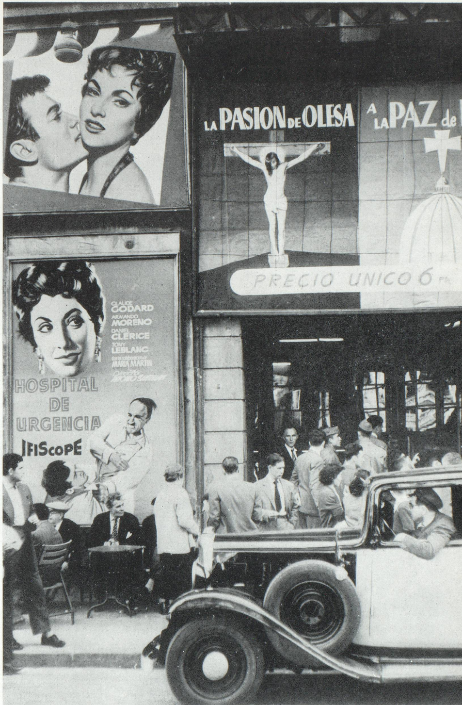
Devant ces affiches où le profane s'oppose au sacré, toute la vie intense d'une rue de Barcelone.

artistes qui s'employèrent à trouver à l'affiche son style propre, tout en adaptant son esthétique aux différentes exigences des goûts et des mœurs.