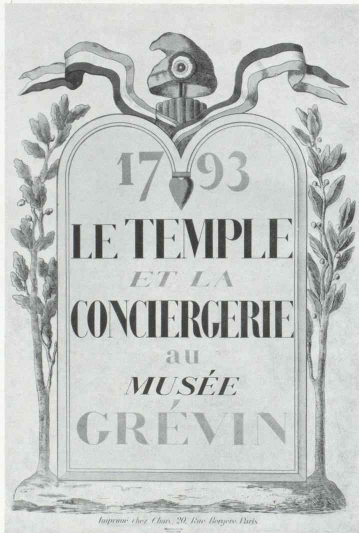
Affiche anonyme, Exposition le Temple et la Conciergerie au musée Grévin, Paris 1893, 122 x 86 cm.

Dans un autre ordre d'idées le peintre affichiste fait appel à un autre élément caractéristique de l'affiche contemporaine : le personnage-type. Créé spécialement et exclusivement pour une marque, cette formule a toujours rencontré les faveurs du public mais à la condition toutefois que le pittoresque du personnage soit toujours doublé d'un visage sympa-