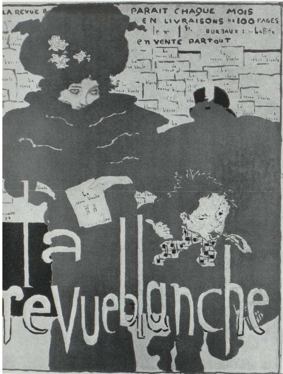
Affiche de Pierre Bonnard, La Revue Blanche, Paris 1894, 76 × 60 cm.

véritable lancement publicitaire sans le concours de l'affiche illustrée.