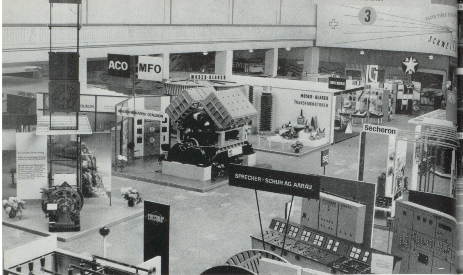
Une offre, à l'échelle mondiale, de l'industrie électro-technique.