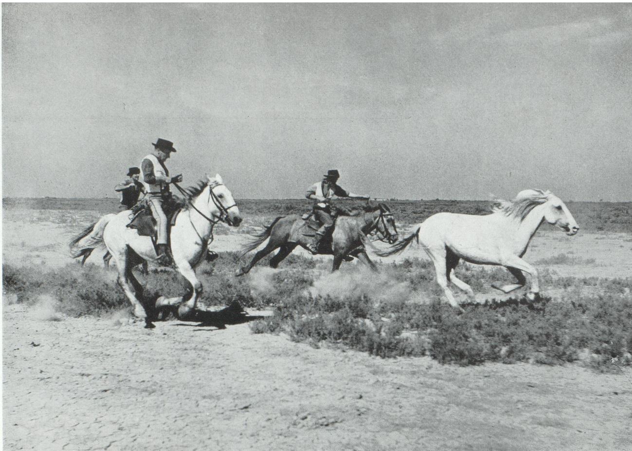
Une photo de Crin Blanc de Lamorisse