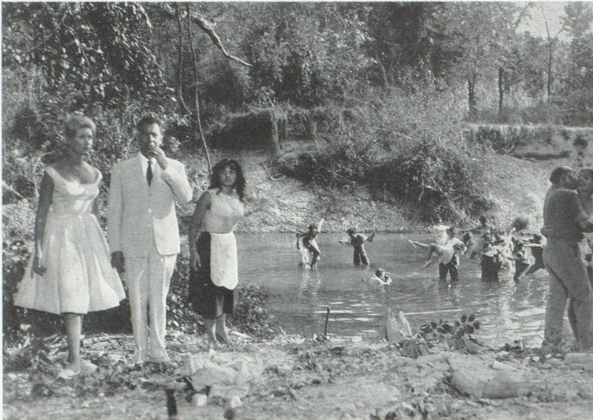
Le déjeuner sur l'herbe de Jean Renoir

Truffaut, plus violent, réussit du premier coup un cinémascope en noir et blanc, Les quatre cents coups . Comme Chabrol, il a assimilé les leçons américaines; Chabrol, et Franju dans La tête contre les murs , montraient le monde de l'adolescence, avant l'heure du choix, dans cette période de « pré-existence » où se mouvaient aussi les personnages de Cocteau. Truffaut choisit le thème d'un enfant envoyé dans une maison de rééducation; il rend présent un univers qui fut jadis le sien. Enfin, Hiroshima mon amour témoigne des dernières recherches de ce qu'on pourrait appeler « l'école lyrique française ». La jeunesse prend conscience du délabrement du siècle, croyances mortes, vie de famille brisée, politique dérisoire, mais elle prend aussi conscience de