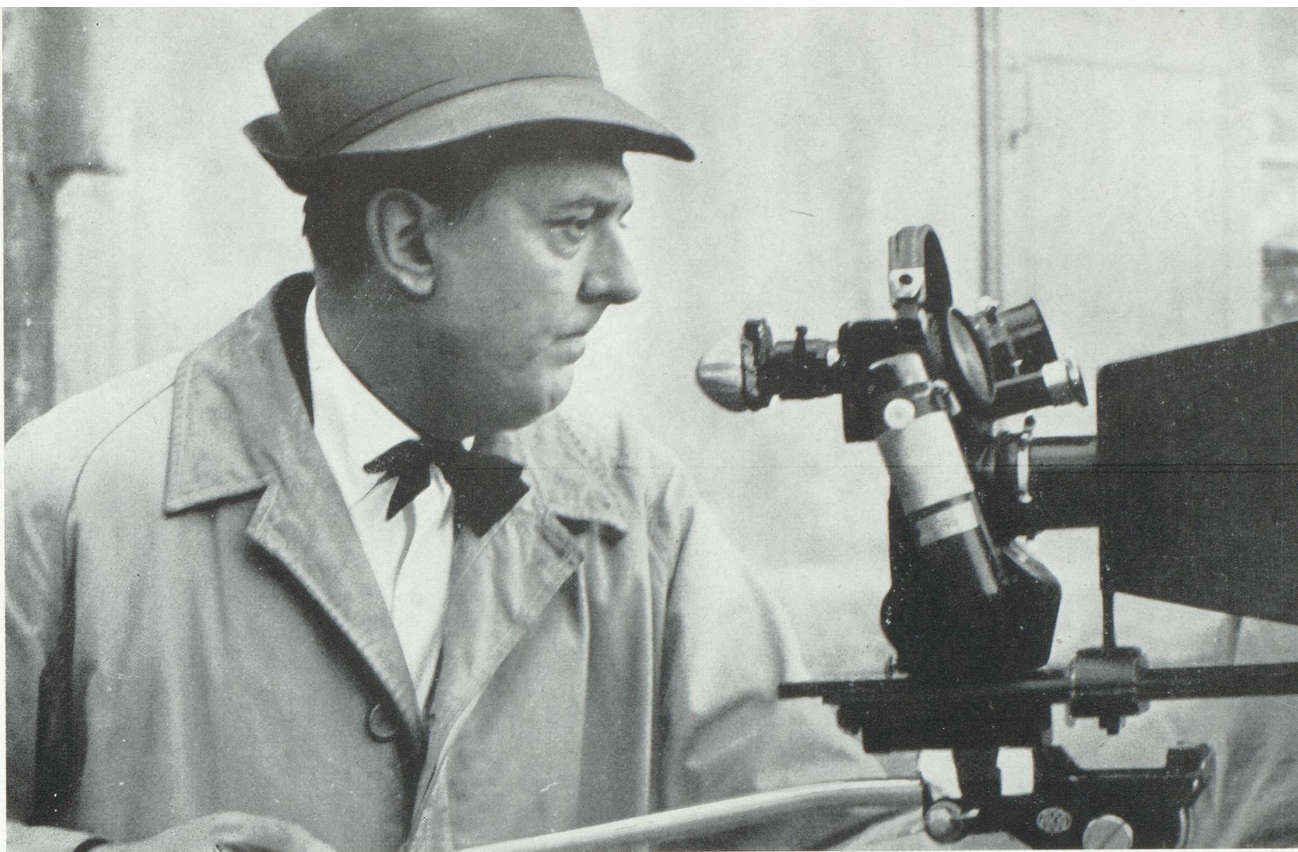
Jacques Tati prépare ses films pendant trois ans

réclame un style; il faut un auteur, une écriture », dit Robert Bresson, qui a écrit lui-même l'adaptation et le dialogue de ses films; son écriture cinématographique l'égalé aux plus grands.