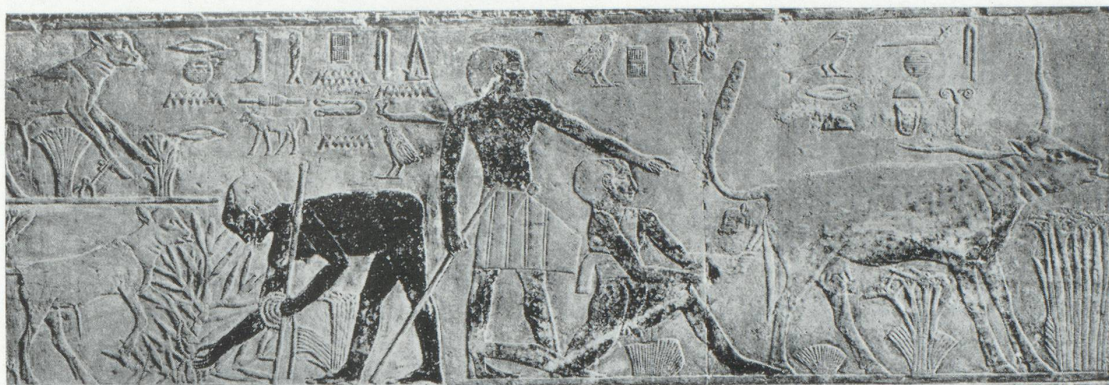
Les gestes éternels du paysan... Relief du tombeau égyptien de Ti à Saggarah.