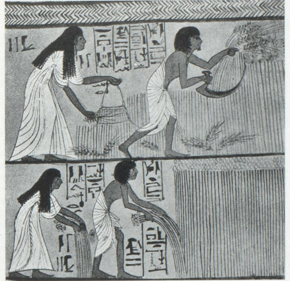
Le travail des champs. Peinture funéraire de la XVIII e dynastie près de Deïr el Médinich

duction. La dernière assemblée générale de l'Association des agriculteurs européens a constaté que cette marge s'est agrandie défavorablement pendant les dernières années et la Commission de la C.E.E., à la suite d'une enquête, a confirmé nettement l'exactitude de cette opinion.