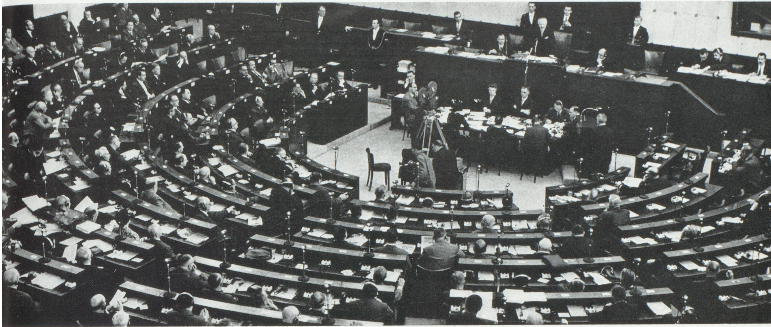
L'Assemblée parlementaire européenne de Strasbourg

— Pour que ce prolongement politique fût efficace, il fallait éviter un certain nombre d'écueils. Tout d'abord, que la nouvelle construction se contente d'ajouter un organisme de plus à la liste des sigles, déjà fort encombrée. Il fallait que ce soit un organisme efficace, si possible sans étiquette, mais avec un contenu. C'est dans cet esprit d'ailleurs que doivent être bannies les querelles de mots et l'opposition entre fédération et confédération. Les gouvernements, pour parfaire leur intégration économique, et d'autre part pour étendre leur union à d'autres domaines, ceux de la politique étrangère, de la défense ou de la culture, avaient besoin de se rencontrer plus souvent. Ce fut le sens des propositions faites par le Gouvernement français. Peu importe le nom que l'on donne à ce rapprochement. L'essentiel c'est d'aboutir.