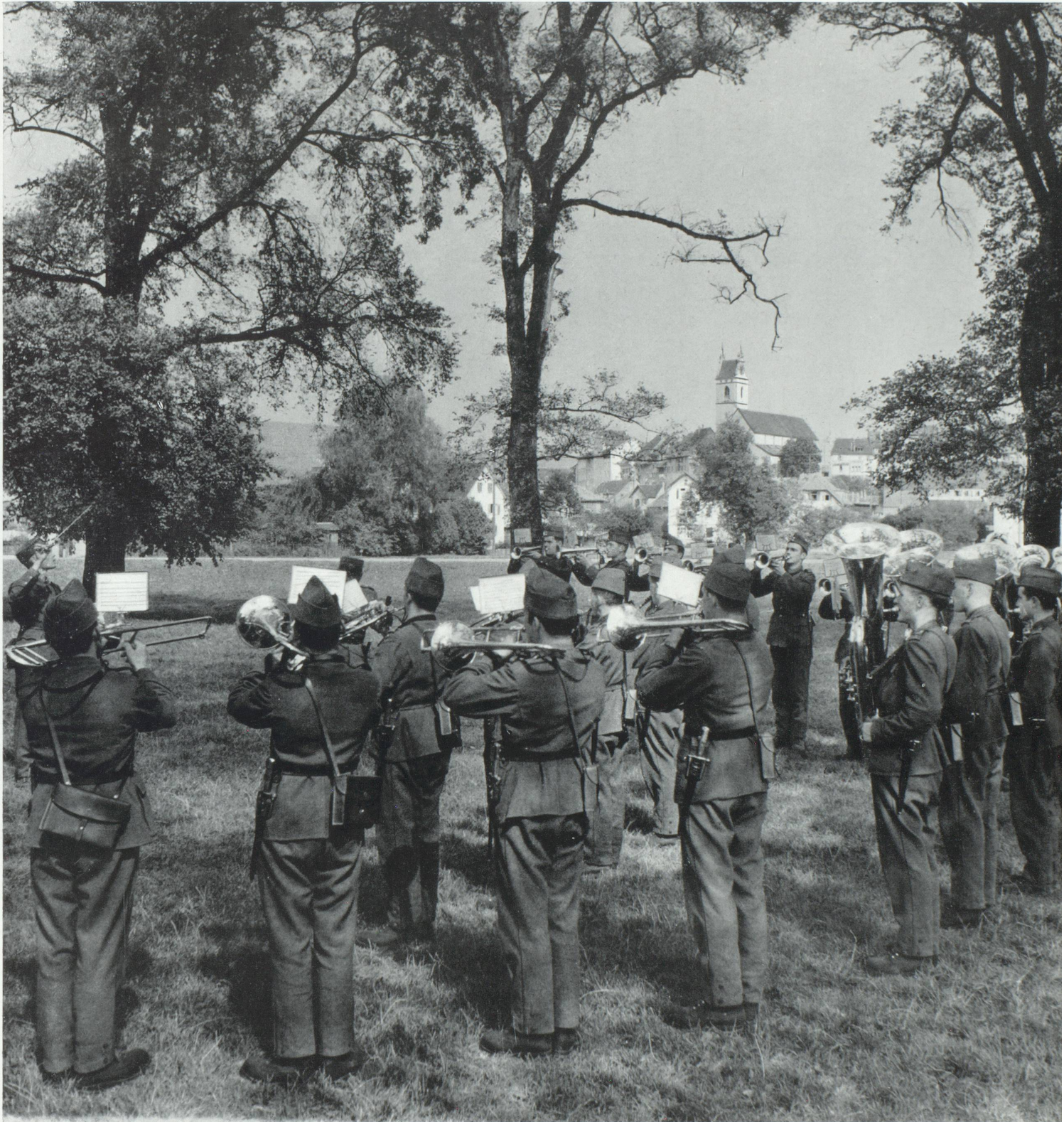
Si toutes les armées du monde voulaient se mettre à l'unisson...