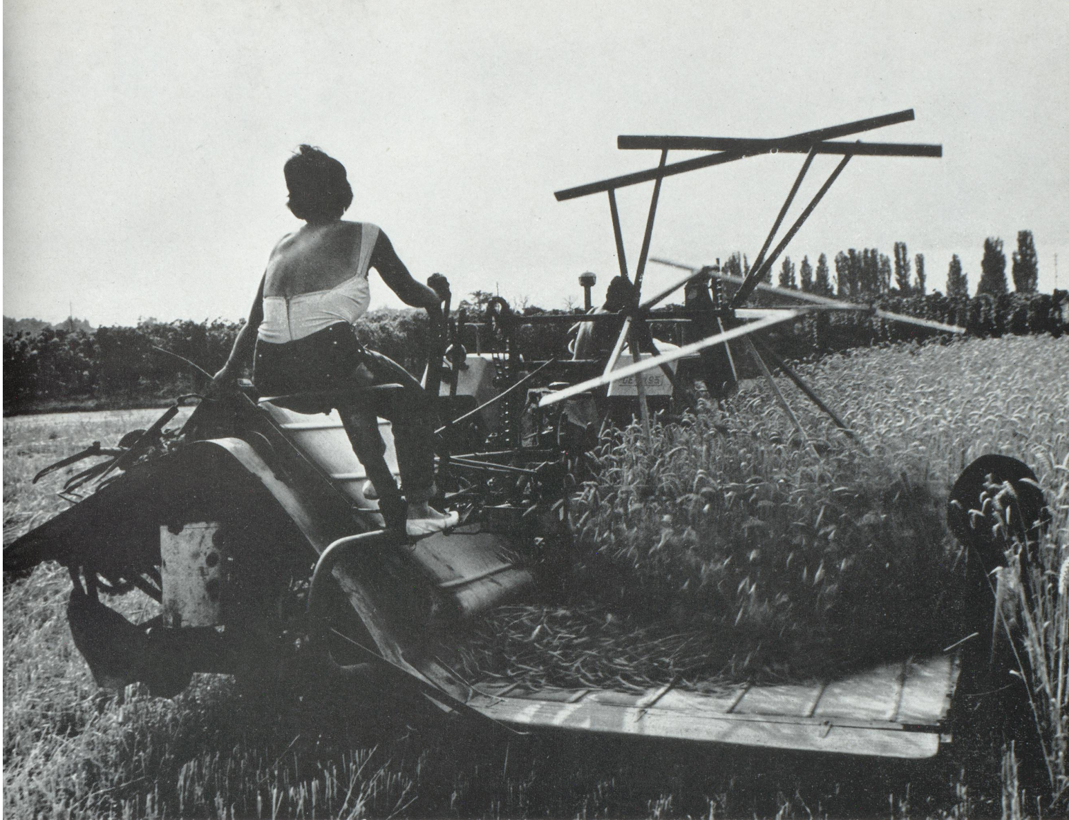
Travaux publics et agriculture : deux secteurs de l'économie où la main-d'œuvre étrangère joue un grand rôle en Suisse

Spirituellement, depuis des générations, la Suisse concilie à l'intérieur de ses frontières des populations de culture germanique, française, italienne. De leur diversité, elle tire une harmonie qui la remplit d'une légitime fierté, et elle se réjouit aujourd'hui de voir la France, l'Allemagne, l'Italie s'engager dans une voie qu'elle sait riche de promesses.