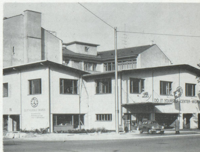
De haut en bas : le premier magasin Migros en 1927; magasin combiné dans la banlieue de Zurich; centre "do it yourself" Migros à Zurich.