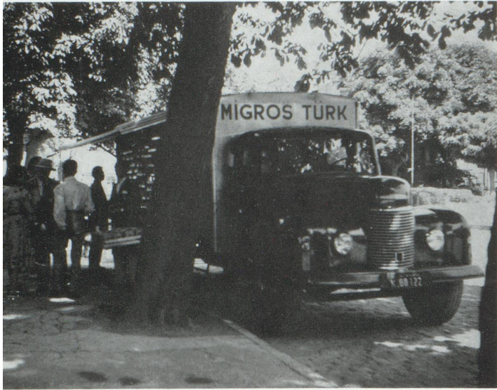
Un camion-magasin de Migros Türk.

prendre des obligations volontaires et supplémentaires envers le public. Le slogan : « Plus on devient puissant, plus on doit servir » est à l'origine de cette conviction. De plus, la situation internationale évolue de telle façon que si le capitalisme, base de l'économie de l'Ouest, ne réussit pas aussi vite que possible à se convaincre de ses responsabilités et de la nécessité de faire volontairement des dépenses extra-commerciales, notre système ne sera pas en mesure de tenir contre celui de l'Est. D'ailleurs la grande vogue de l'aide aux pays sous-développés prouve que cette idée gagne du terrain.