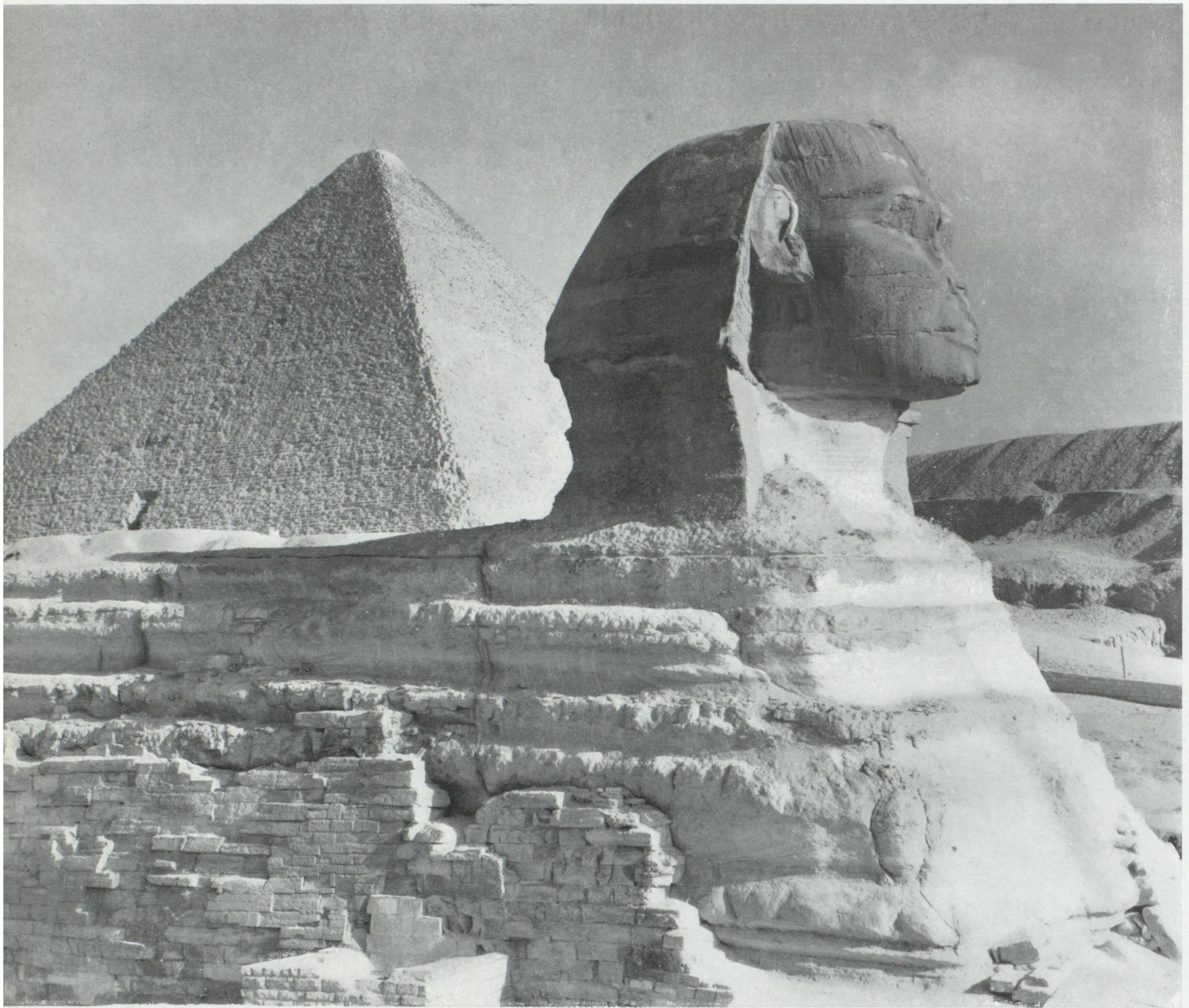
Pyramide de Chéops à Gizeh.

Même quand ils n'étaient pas consciemment racistes, les Européens ont pensé, pendant au moins deux siècles, que le don d'inventer était un de leurs privilèges naturels. On nous a enseigné une histoire à la mesure de cette illusion : non seulement elle annexait ingénument la Grèce, et à travers elle les civilisations du Nil et de l'Euphrate, mais de l'Antiquité à nos jours, elle concevait notre développement comme autonome et ne devant rien, ou peu de choses, aux mondes étrangers. Bref, nous avons reçu l'éducation d'un peuple élu.