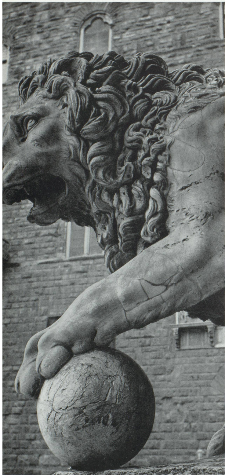
Influence égyptienne à Florence: 4 000 ans après le Sphinx, le Lion de la Piazza della Signoria s'inspire des mêmes symboles.

faite d'apports universels, s'est substituée une civilisation scientifique, capable de synthèse autonome, indépendante de la diversité géographique, dont nous étions le centre. Mais, si ces succès nous appartiennent, ils ne constituent plus la preuve que seuls les cerveaux européens en étaient capables : notre pensée fut plus une constatation des expériences, dont les éléments se trouvaient rassemblés à notre portée, qu'une génération spontanée d'inventions, puisqu'aujourd'hui la Sibérie ou l'Amérique fabriquent aussi bien, ou mieux, les appareillages dont nous avons été les premiers constructeurs. Le Hoang-Ho et le Gange en sont, à leur tour, capables et bientôt le Congo. Le privilège qui nous demeure n'est donc qu'une certaine antériorité que nous avons déjà payé des mille inconvénients d'un morcellement politique, linguistique, économique qui, au-delà d'une certaine limite, paralyse la croissance de nos installations.