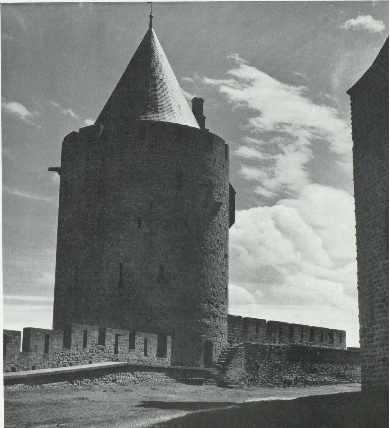
Les murs de la cité médiévale de Carcassonne.