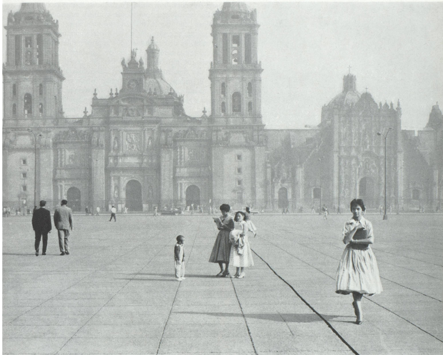
Baroque espagnol en Amérique du Sud : la cathédrale de Mexico.

devraient nous faire réfléchir à l'ambiguïté des définitions cartographiques plus circonstanciées que logiques. D'ailleurs, au moyen-âge, pour distinguer l'Occident de l'Orient, la ligne de démarcation suivait, à peu près, celle qui séparait les religions romaine et grecque, et Byzance a été orientale, avant même d'être musulmane. L'Europe, à vrai dire, était, à cette époque, un carrefour où, grâce au christianisme, mais aussi à l'Islam, par l'Italie et l'Espagne, comme par Vienne, Paris et Londres, se sont trouvées les escales essentielles d'une route