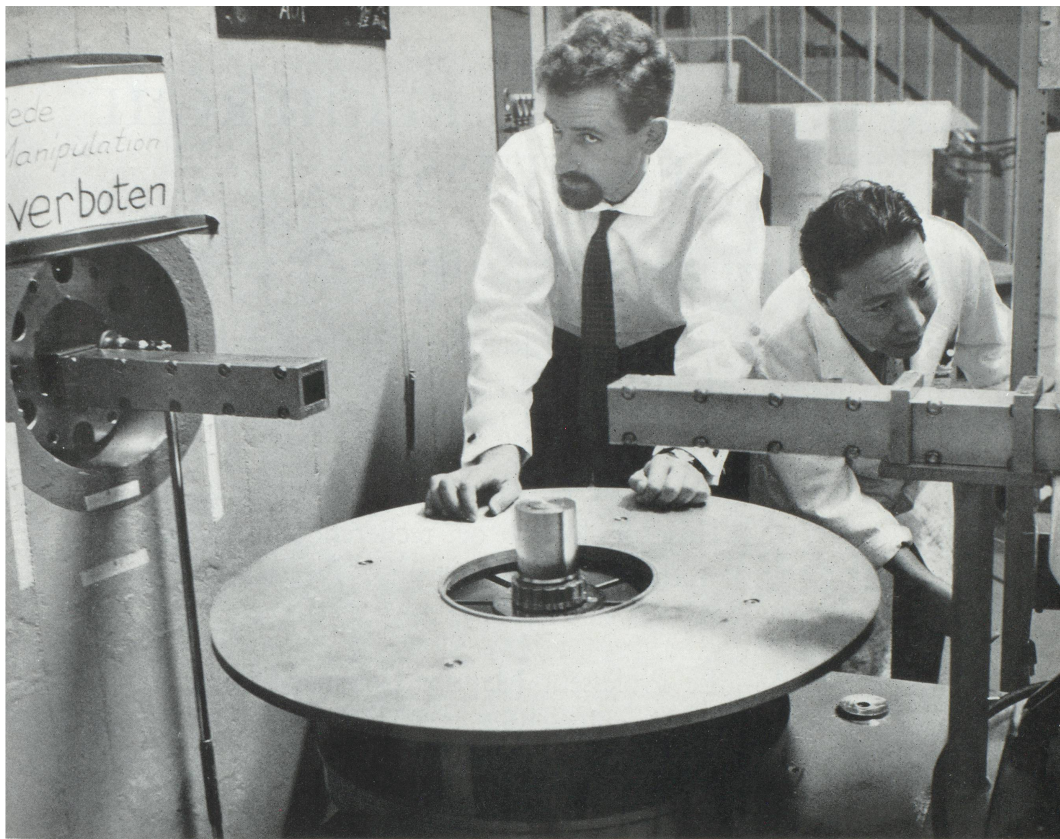
Deux chercheurs à l'Institut de Würenlingen

importants, surtout à l'occasion de jubilés ou de la construction de nouveaux bâtiments, mais encore par des subventions ou la mise à disposition de personnel. De nombreux professeurs sont également conseillers de diverses industries. L'université conserve néanmoins son entière liberté et l'industrie ne cherche pas à s'immiscer dans le choix des sujets de recherche. Ce sont les industries chimiques et pharmaceutiques qui entretiennent les relations les plus étendues avec les instituts universitaires.