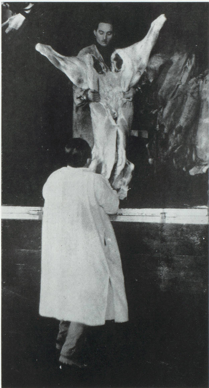
Pénurie de viande de bœuf.