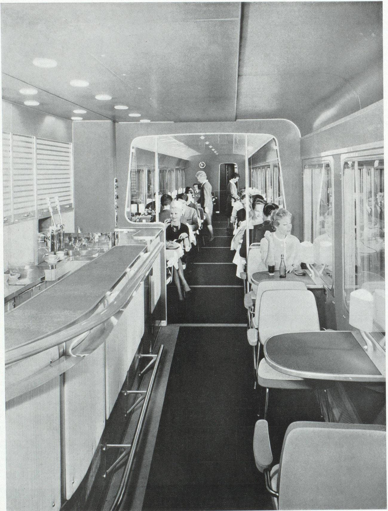
DANS UN TRAIN T. E. E. LE BAR JOUXTANT LE RESTAURANT