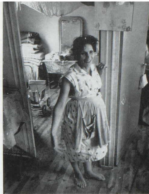
«... on profite de leur manque d'exigence pour les entasser à douze par chambre...»

Peu à peu les hôpitaux sont surchargés et les maternités ont affaire à une « clientèle » nouvelle, insensible aux conseils de « planning familial ». Les mariages mixtes sont de plus en plus nombreux et les milieux protestants s'alarment d'une inflation artificielle qui compromet les répartitions confessionnelles. Dans les villes où la pénurie de logements reste inquiétante, des Suisses se fâchent tout rouge de savoir qu'on songe à construire des centaines d'appartements pour des étrangers. Il y a ainsi de violentes poussées de xénophobie. Les offices sociaux s'effor-