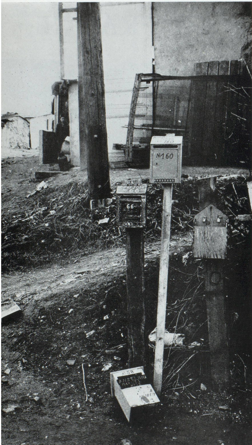
LA JOIE DES FACTEURS...

A travers cette esquisse conjoncturelle de la main-d'œuvre étrangère de la France, on ne peut discerner clairement ce qui, structurellement, distingue la politique française d'emploi de forces de travail extérieures de celle des autres pays industriels d'Europe occidentale, et singulièrement la Suisse. Or, il y a une différence fondamentale, c'est que l'immigration de travailleurs étrangers n'est pas un pis aller imposé par des circonstances il est vrai persistantes, mais répond à une nécessité démographique qui a