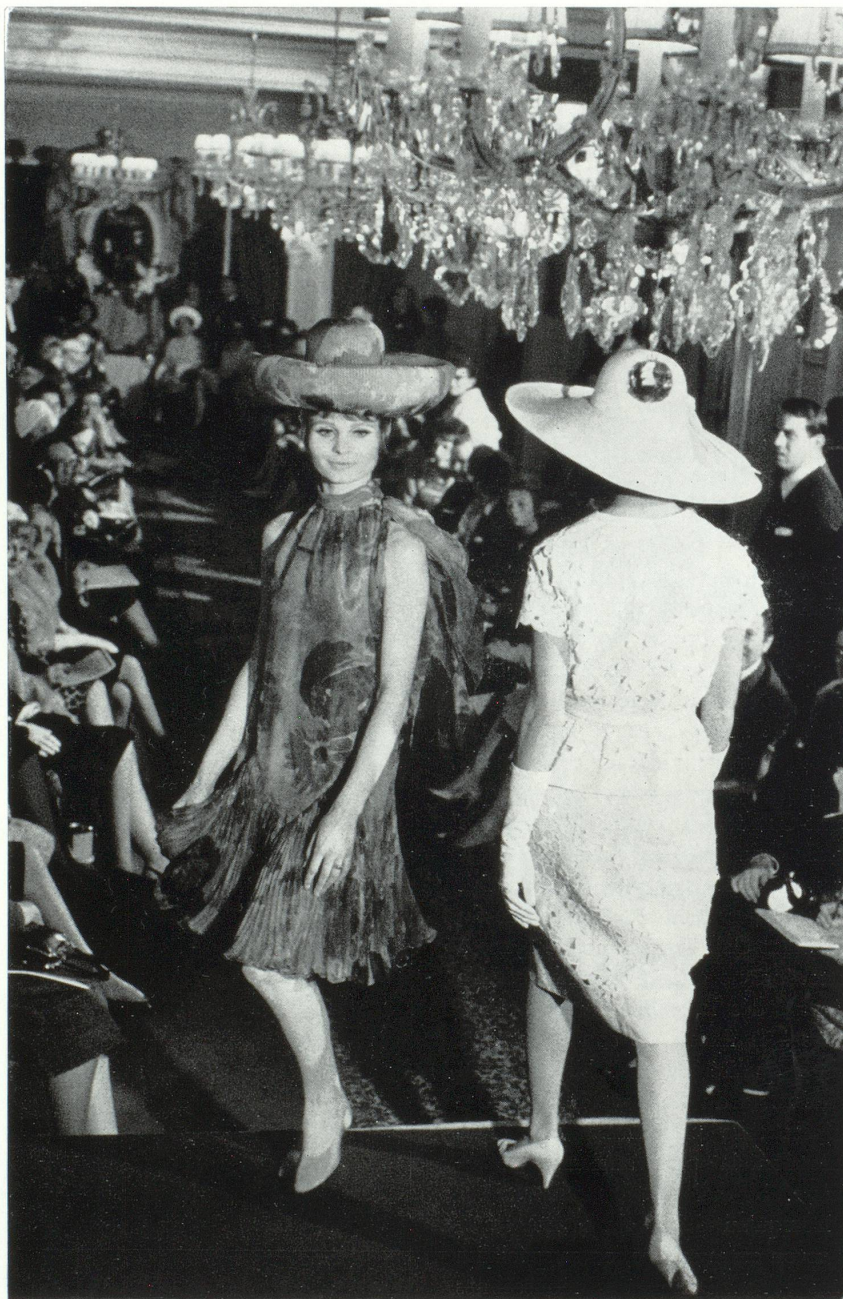
A droite de la photo : Deux-pièces de Nina Ricci en broderie de Saint-Gall.