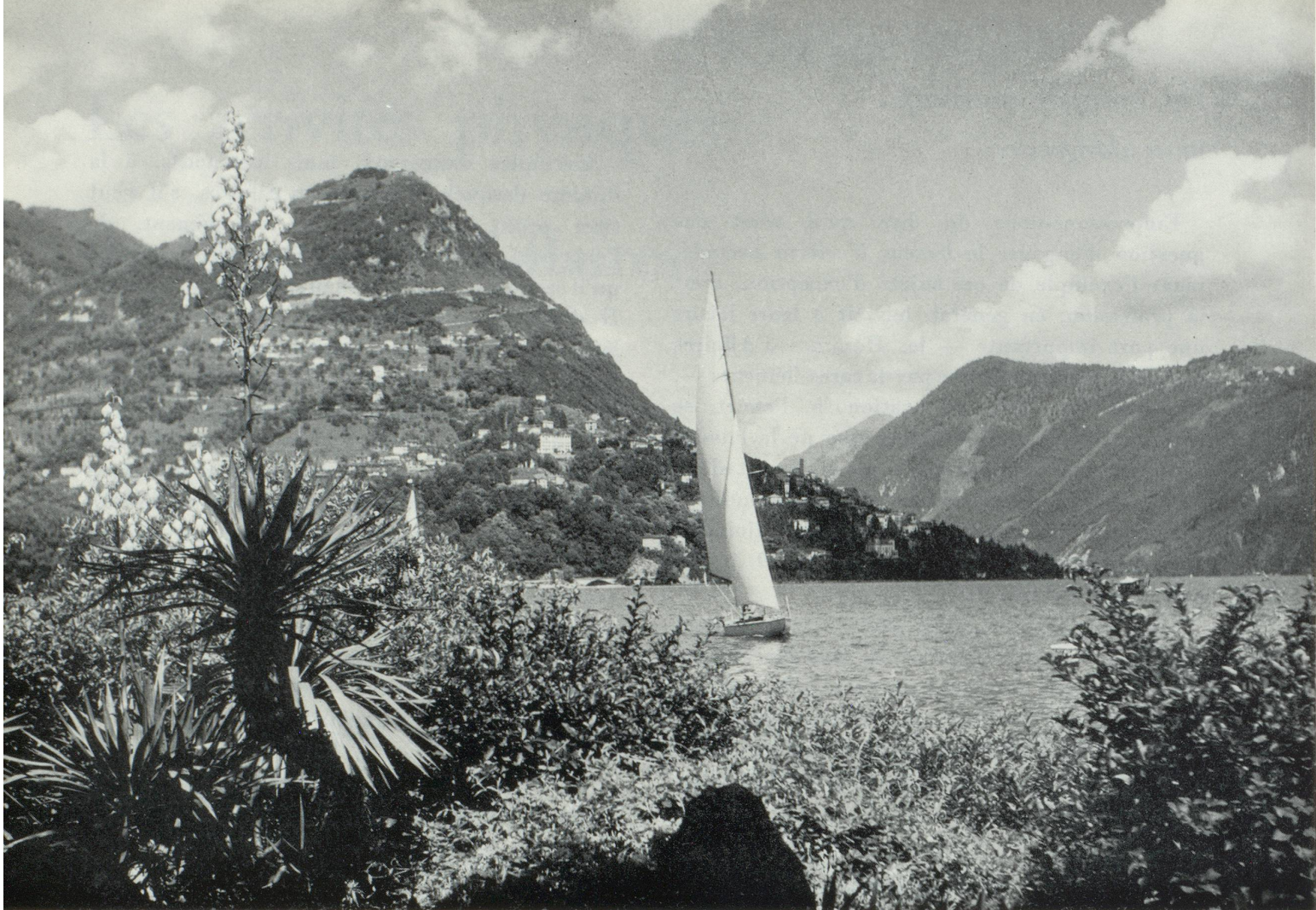
Voilier sur le lac de Lugano dans le fond le Monte Brè (Photo office national suisse du tourisme).

donc dangereuse , possédant un seuil de toxicité variable selon les individus, leur âge et leurs dispositions du moment.