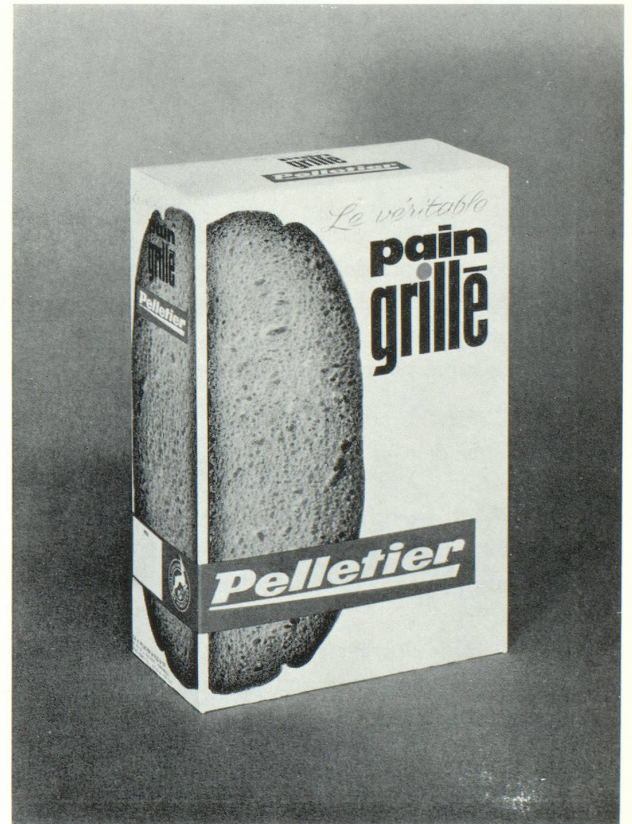
Une image nette, un texte court, un graphisme simple, permettent d'évoquer puissamment la qualité du produit.