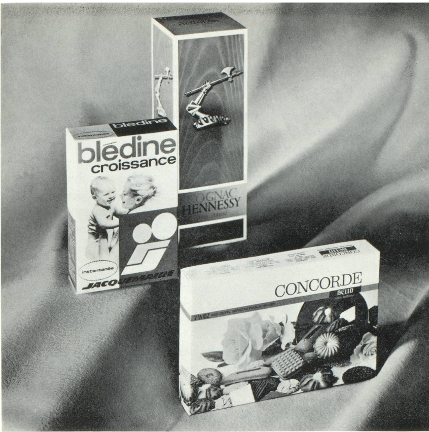
Suivant le produit à vendre, la présentation doit être : luxueuse pour un alcool; évocatrice pour un produit de diététique infantile; flatteuse pour une gourmandise.