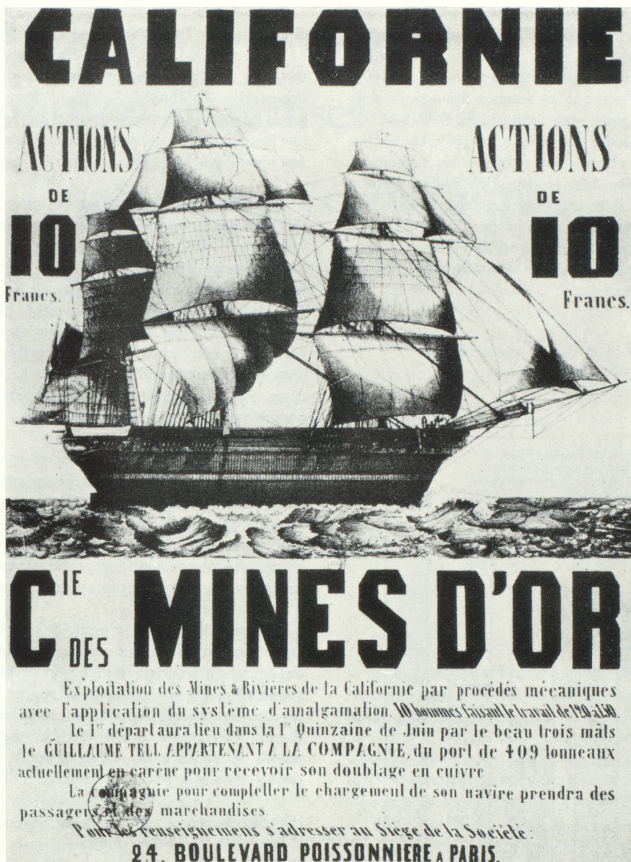
Affiche des Mines d'Or de Californie, lithog. sur papier jaune (vers 1850) (Cabinet des Estampes). (Photo aimablement mise à notre disposition par les Éditions Delpire.)

sur le marché financier (placement des actions et des obligations). Stimulées elles aussi par la concurrence, elles ont imaginé de nouvelles formes d'intervention capables de s'adapter plus efficacement aux goûts ou aux besoins de leur clientèle.