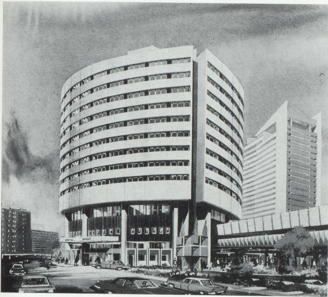
Paris Pental Hôtel, La Défense, Courbevoie.