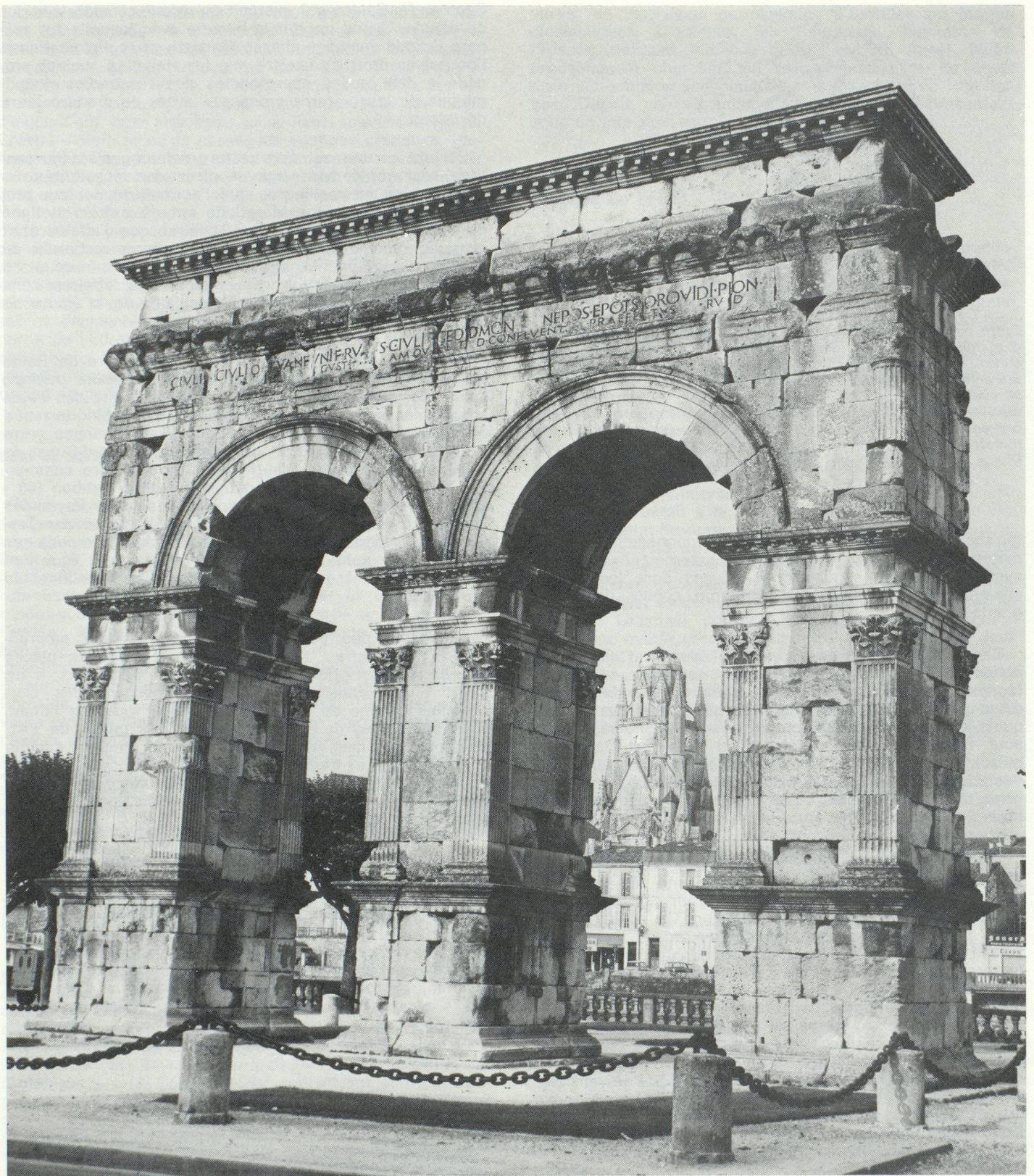
Saintes : Arc de triomphe romain (sous domination romaine Saintes comptait trois fois plus d'habitants qu'aujourd'hui).

Mais cela ne permet sûrement pas de conclure à l'absence de relations commerciales. Car, à l'époque, la conversion des monnaies d'origine lointaine se faisait au moyen de la balance, ce qui aboutissait souvent à des cours inférieurs d'un tiers et plus à la relation d'échange. Aussi, les partenaires santons et helvètes ont-ils pu se