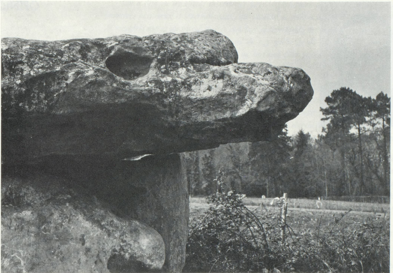
Partie de Dolmen près de Jarnac. — Le regard énigmatique du fond de l'antiquité celtique ne nous révèle rien sur l'époque où les Helvètes étaient attendus dans le pays. Les druides n'écrivaient pas.

Or, la ville de Saint-Maurice en Valais s'appelait Agaunum jusqu'au troisième siècle. Hasard fortuit ? C'est peu probable. Mais les certitudes manquent.