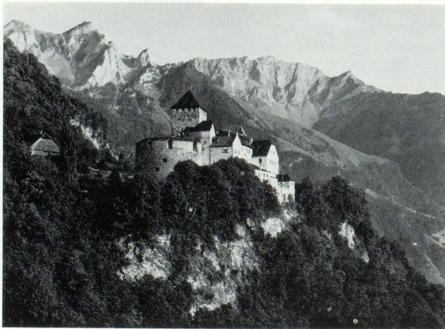
Le château de Vaduz, résidence du Prince Régnaant de Liechtenstein.

Le Liechtenstein mène une politique extérieure indépendante qui au cours des dernières années a accentué plus fortement son orientation dans le domaine multilatéral. Sur le plan des relations bilatérales, la Principauté a conclu environ 60 accords, dont un nombre considérable avec ses deux voisins, l'Autriche et la Suisse.