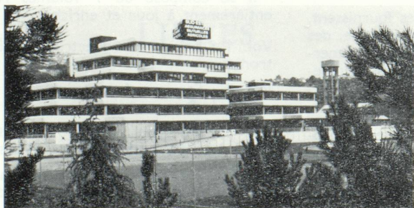
- Vue de l'immeuble -