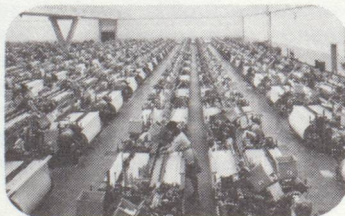
Salle de tissage équipée de machines à tisser à navettes, type Riiti-C1000

Livrer seulement des machines-outils, des machines textiles ou des installations de fonderie ne serait que besogne faite à moitié. Ce que nous fournissons, c'est le savoir qu'il faut pour les mettre en œuvre. Ce que nous fournissons, ce sont des études du marché et de la demande, des solutions du financement et des approvisionnements. Et enfin, la mise en route ainsi que l'entraînement et l'éducation du personnel.