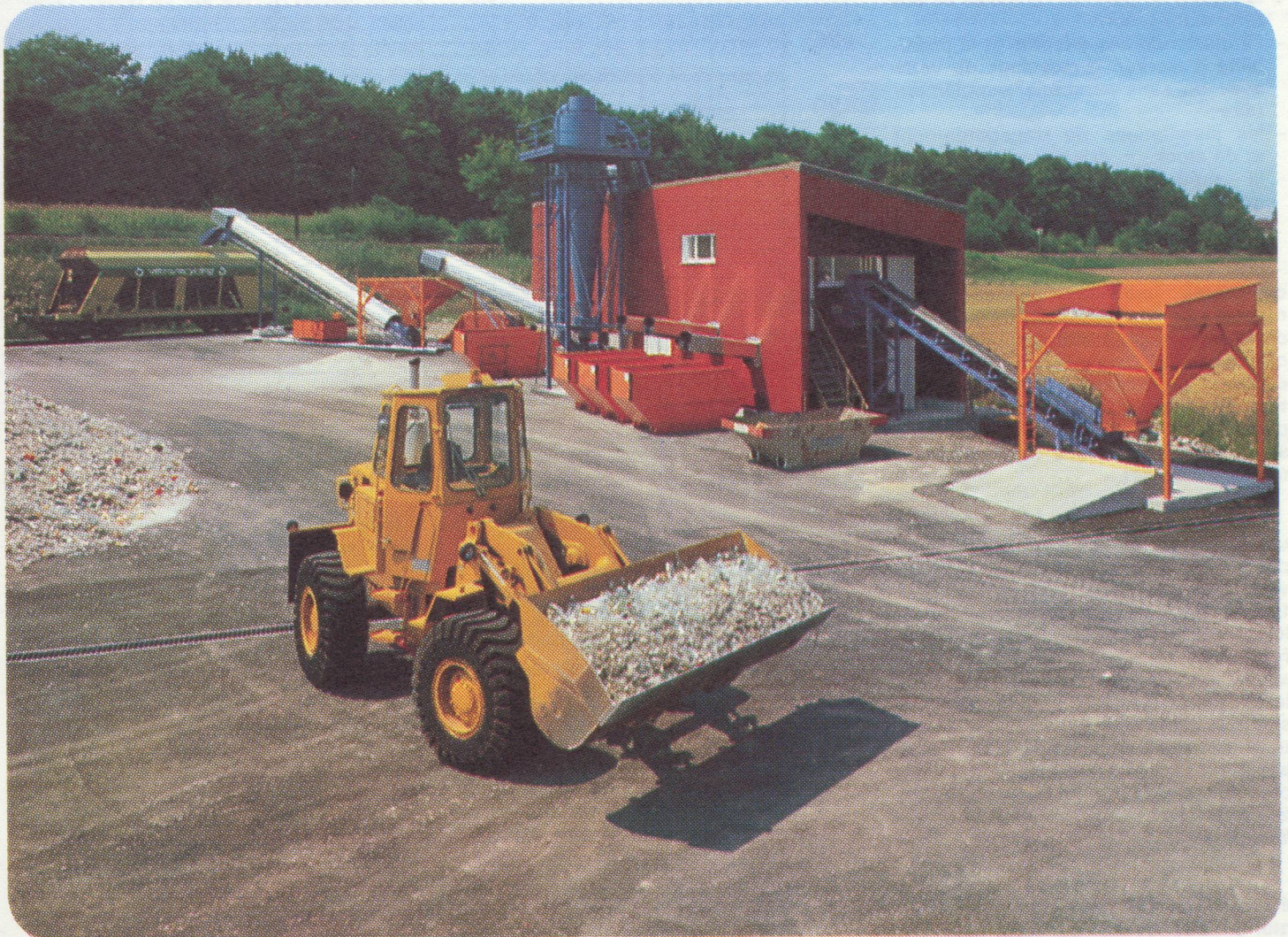
Centre de stockage et de conditionnement de Rümlang (Zürich).

– l'emballage « combi » : le consommateur ne paie pas de consigne, mais peut et doit cependant rapporter l'emballage comme s'il était consigné. Selon les circonstances du marché, l'emballage peut toutefois être considéré comme étant à usage unique et échouer dans ce cas dans le conteneur de verre usagé.