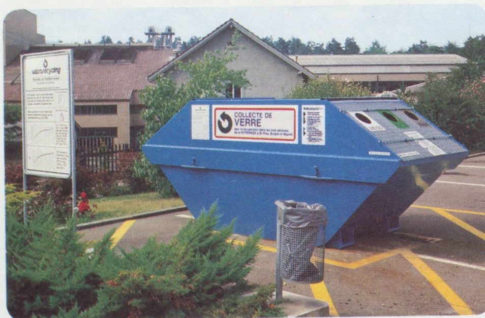
Collecteur de verre, standard n° 1.

Il n'en faut pas plus pour expliquer le succès rapide de notre entreprise.