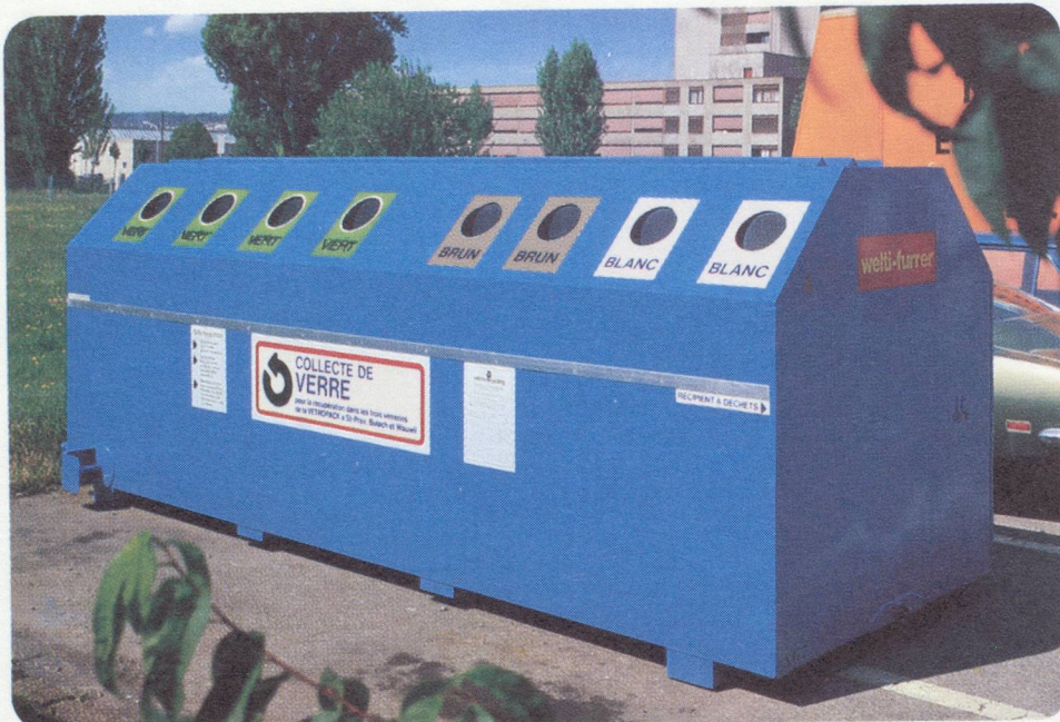
Collecteur de verre, standard n° 2

Les verreries ont offert partout le même prix d'achat pour le verre usagé ainsi que la prise en charge totale des frais de transport à partir de n'importe quel endroit de Suisse. Cette initiative, fondée sur le principe suisse de la solidarité fédérale, a largement contribué au succès de l'entreprise. Comme moyen de transport, nous avons choisi les chemins de fer fédéraux. Cela aussi fait partie de notre philosophie. Nous estimons en