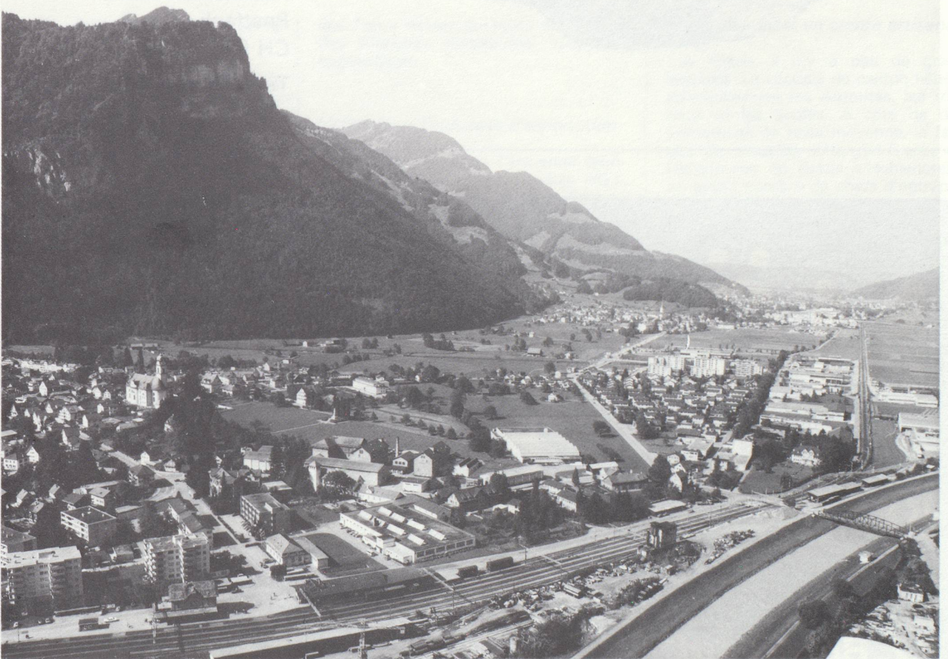
La plaine de la Linth : région à forte densité de population et hautement industrialisée.

Le Conseil d'État dispose d'un délégué au développement économique qui est, à tous égards, à la disposition de ceux qui s'intéressent à un emplacement dans le canton de Glaris, et qui coordonne les intérêts et les besoins des entreprises désirant s'implanter ou se transplanter sur son territoire. De toute façon, l'idée de faire des investissements dans le canton de Glaris est à retenir.