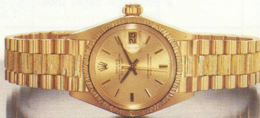
La Rolex Lady-Datejust. Documentation sur demande à SAF des Montres Rolex, 10 avenue de la Grande-Armée, 75017 PARIS.

Une Rolex mérite le prestige dont elle jouit.