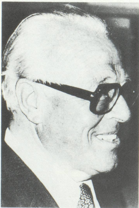
M. Pierre Graber, Ancien Président de la Confédération helvétique.