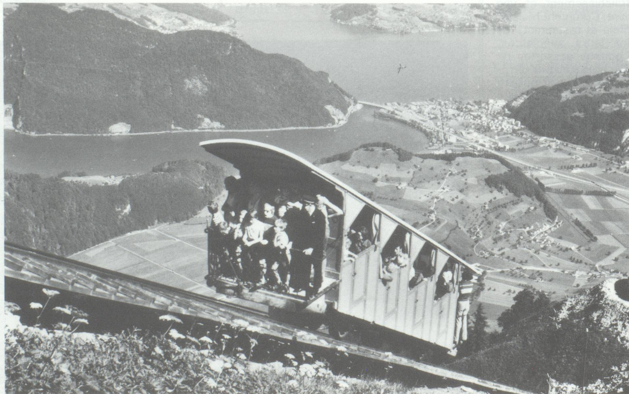
Téléphérique du Stanserhorn

Le canton de Nidwald, avec ses quarante kilomètres en bordure de lac et ses magnifiques montagnes, constitue