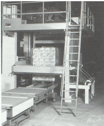
Suremballage des charges palettisées sous film rétractable. Photo : Suremballeuse intégrale Uni-Pal® Thimon, Aix-les-Bains.

Suivent quelques rubriques à petits chiffres : balances, ensacheuses, étiqueteuses, etc.