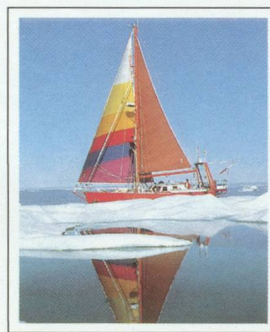
VAGABOND II SOUS VOILE AU MILIEU DE LA BANQUISE.

Vagabond II, son minuscule voilier brise-glaces, il a, le premier, franchi à la voile le passage du Nord-Ouest du Pacifique à l'Atlantique, contre les vents, les courants et les dégels. Une expédition qui a nécessité six années d'efforts.