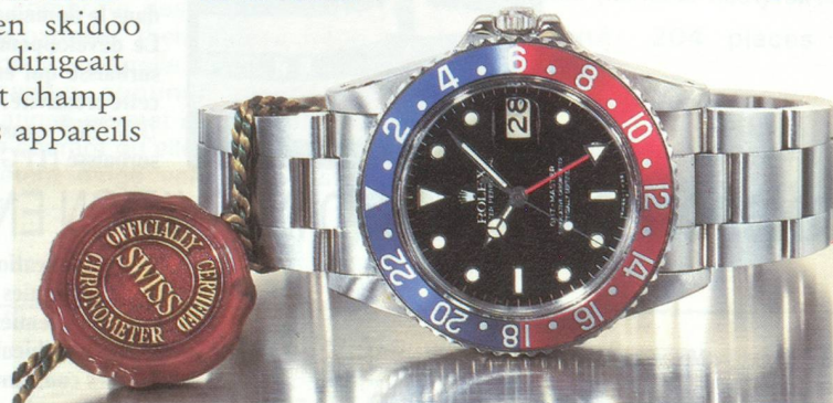
ROLEX GMT MASTER. CHRONOMÈTRE EN ACIER. ÉGALEMENT DISPONIBLE EN OR 18 CT OU EN OR ET ACIER. DOCUMENTATION SUR DEMANDE À S.A.F. DES MONTRES ROLEX, 10 AVENUE DE LA GRANDE-ARMÉE, 75017 PARIS.