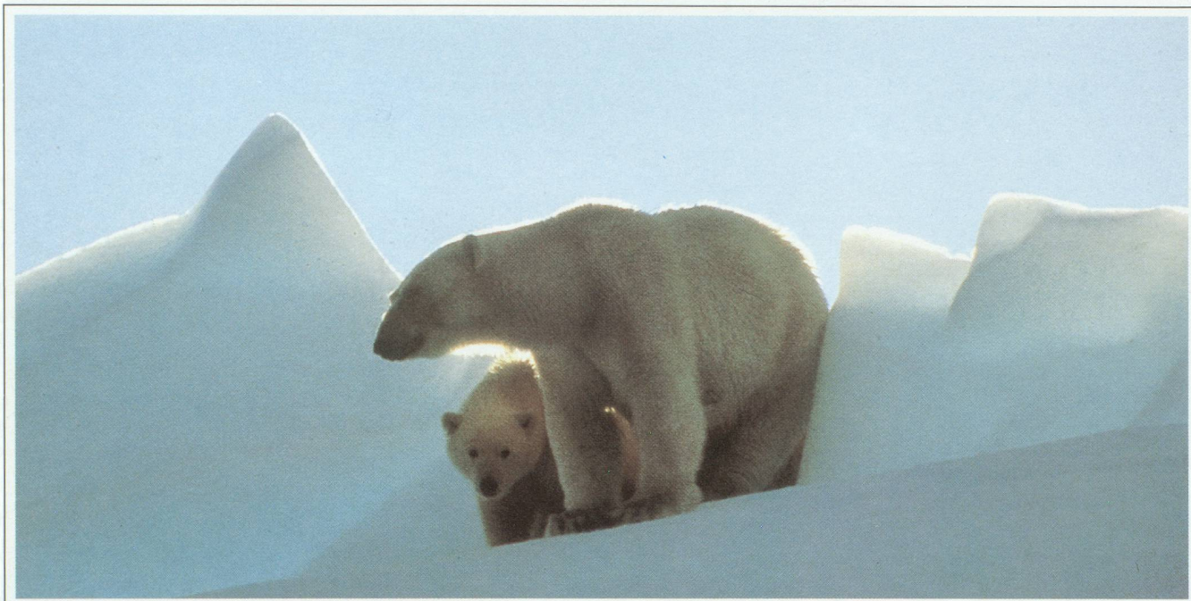
UNE OURSE ET SON OURSON, EFFRAYÉS PAR L'ARRIVÉE DE VAGABOND II, SE RÉFUGIENT SUR UN ICEBERG.