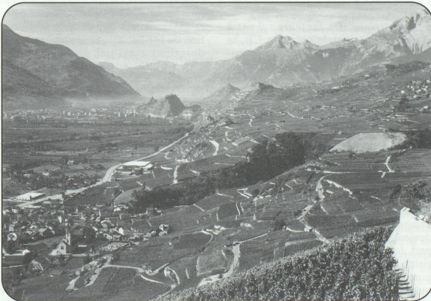
...L'agriculture suisse est sans doute l'exemple le plus patent de protectionnisme actif. Les coûts de cette politique pour le consommateur et contribuable du pays sont estimés à quelque 7 milliards de Francs suisses par an...

c) Branches apparentées et fournisseurs : les infrastructures publiques ont beaucoup de peine à s'adapter aux besoins de la demande ; en comparaison internationale, le réseau de chemins de fer est vieux et surchargé. Pour ce qui est des conditions de démarrage offertes aux nouvelles entreprises, la Suisse n'apparaît pas particulièrement progressiste par rapport aux autres pays. Les interventions suivantes de l'Etat exercent notamment un effet négatif sur la création et le développement de nouvelles entreprises assumant des risques élevés : la double imposition rend plus difficile l'acquisition de capital-