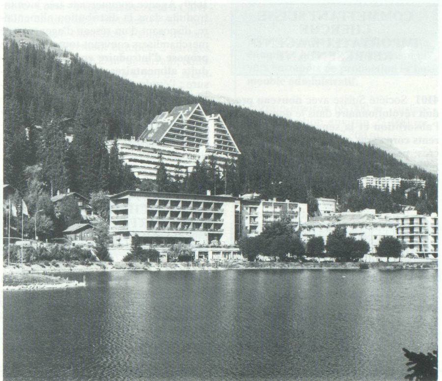
Crans-Montana au-dessus de la vallée du Rhône en Valais. Lac Grenon

La plaine-Morte... un paradis blanc qu'on atteint, en été, au milieu des marmottes et des perdrix des neiges, des violettes et des campanules. La légende veut