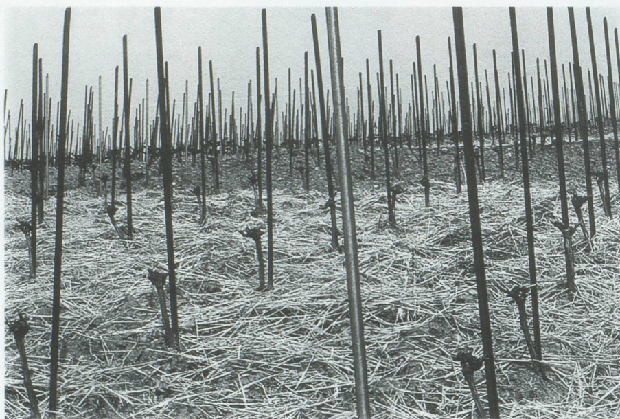
Essai de lutte contre l'érosion au moyen de la paille dans une vigne conduite en gobelet traditionnel.