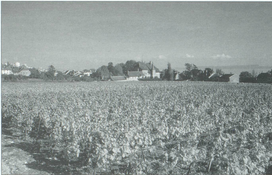
Auvernier, plus grande commune viticole du vignoble neuchâtelois.