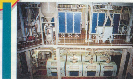
Moulin de Surgères, 200 t/24h